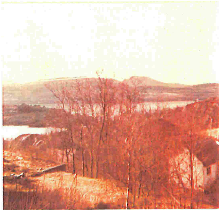
2. Bilde fra 1971 som viser del av terrenget mellom G.nr. 133 og B.nr. 79, 27, og 31.