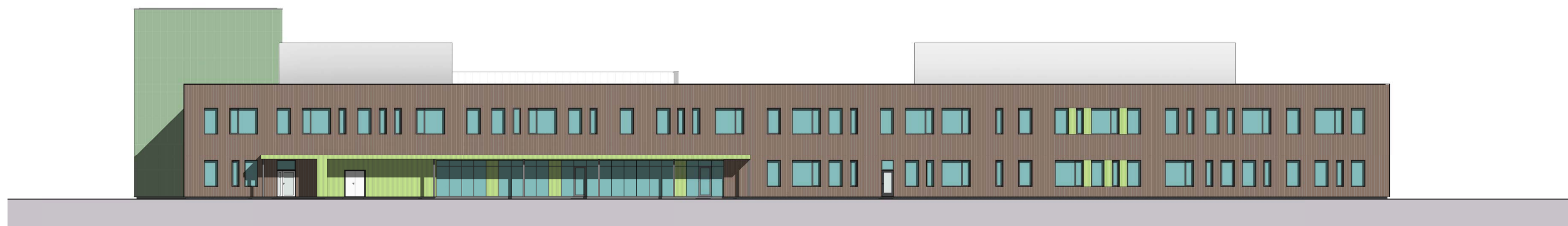
1 Nord 1 : 200