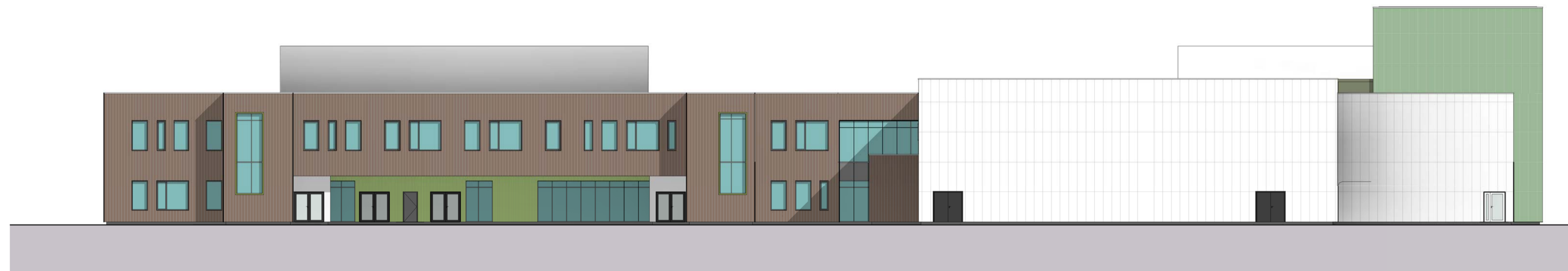
2 Sør 1 : 200