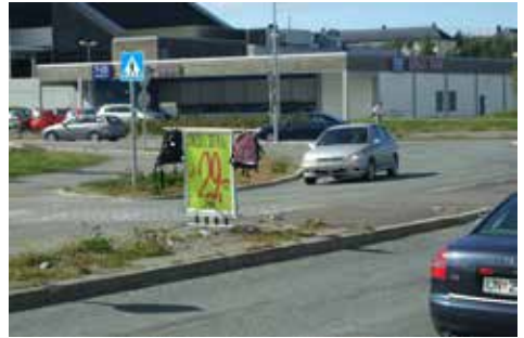
Ulovleg reklame på trafikkøy.

Reklame langs vegen er trafikkfarleg dersom han hindrar nødvendig sikt, for eksempel i kryss eller ved gangfelt. Reklame kan også skape trafikkfarlege situasjonar dersom han tar merksemda bort frå vegen og trafikken, det vil seie skaper distraksjonsfare. På fortau og gangvegar kan reklame vere til hinder for fri ferdsel, særleg for syns- og rørslehemma.