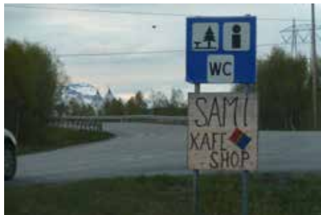
Ulovleg reklame festa til trafikkskilt.