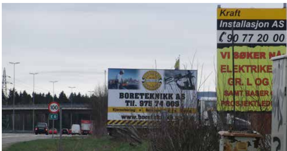
Ulovleg reklame langs motorveg.