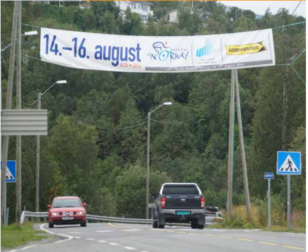
Ulovleg reklame ved gangfelt/busshaldeplass.

I denne brosjyra finn du informasjon om ein del viktige reglar som regulerer reklame langs offentlig veg.