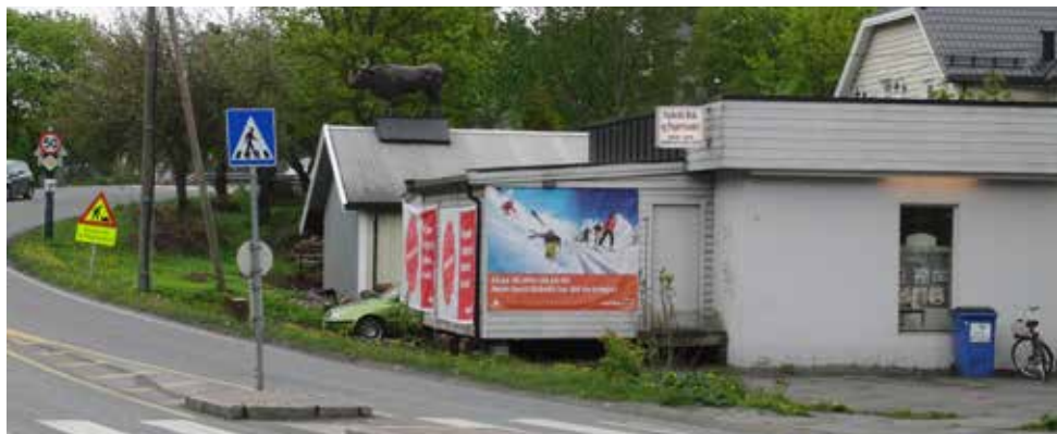
Ulovleg fasadereklame ved gangfelt..