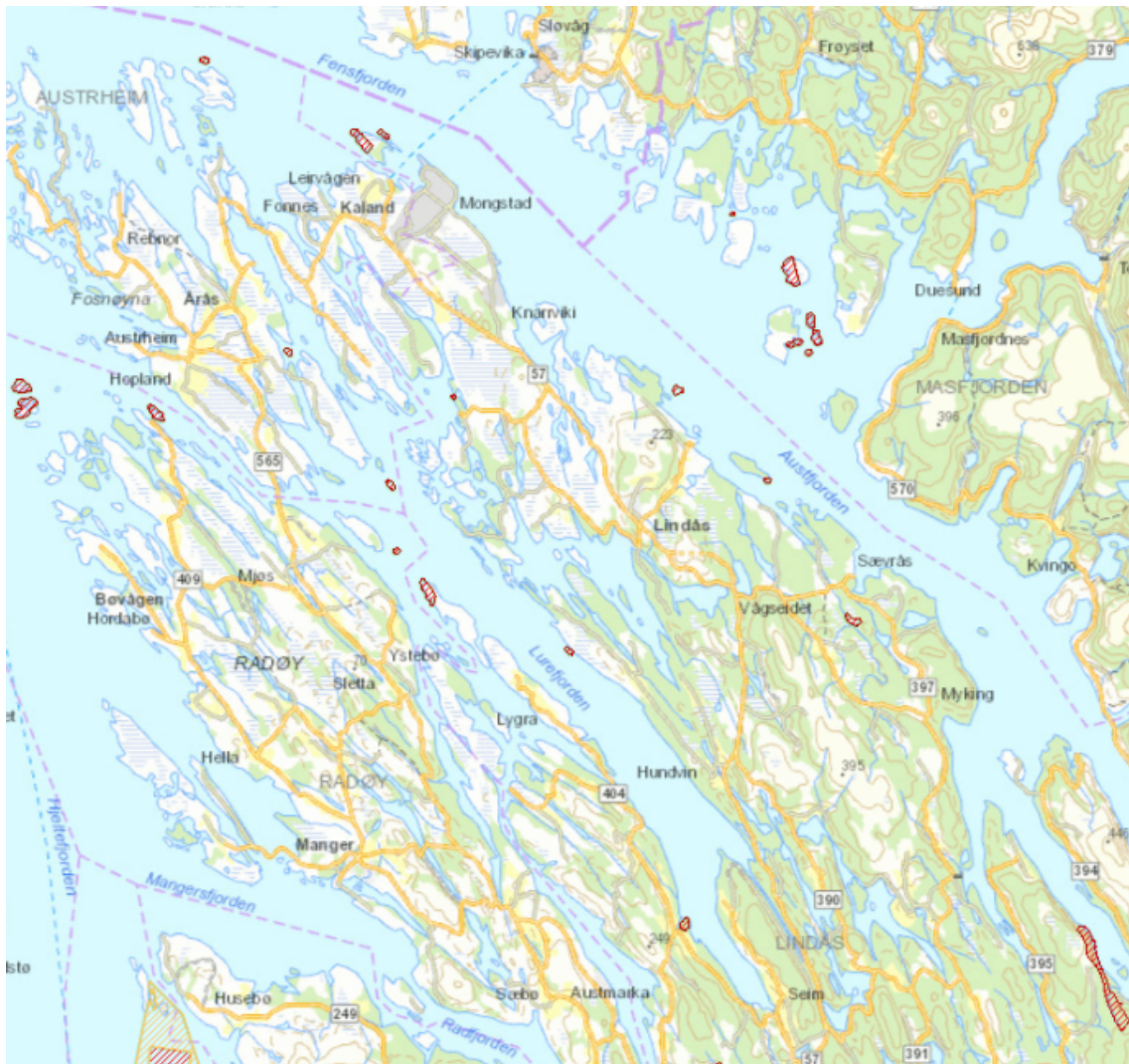
Figur 4: Kartet er eit oversiktsbilete over dei allereie eksisterande verneområda (skravert i rødt) innafor det føreslåtte kandidatområdet for marint vern, og i nærleiken utanfor dette.

Det er i dag fem mindre sjøfuglreservat i Lurefjorden og Lindåsosane. Desse blei oppretta i 1987 for å verne om hekkeplassar til sjøfuglane. Reservata omfattar holmar med ei sone på 50 m i sjøareala rundt der det er ferdselsforbod i hekkesesongen. I tillegg ligg naturreservatet Vollom ned mot kandidatområdet. Der er verneføremålet å ta vare på ein bøkeskog.