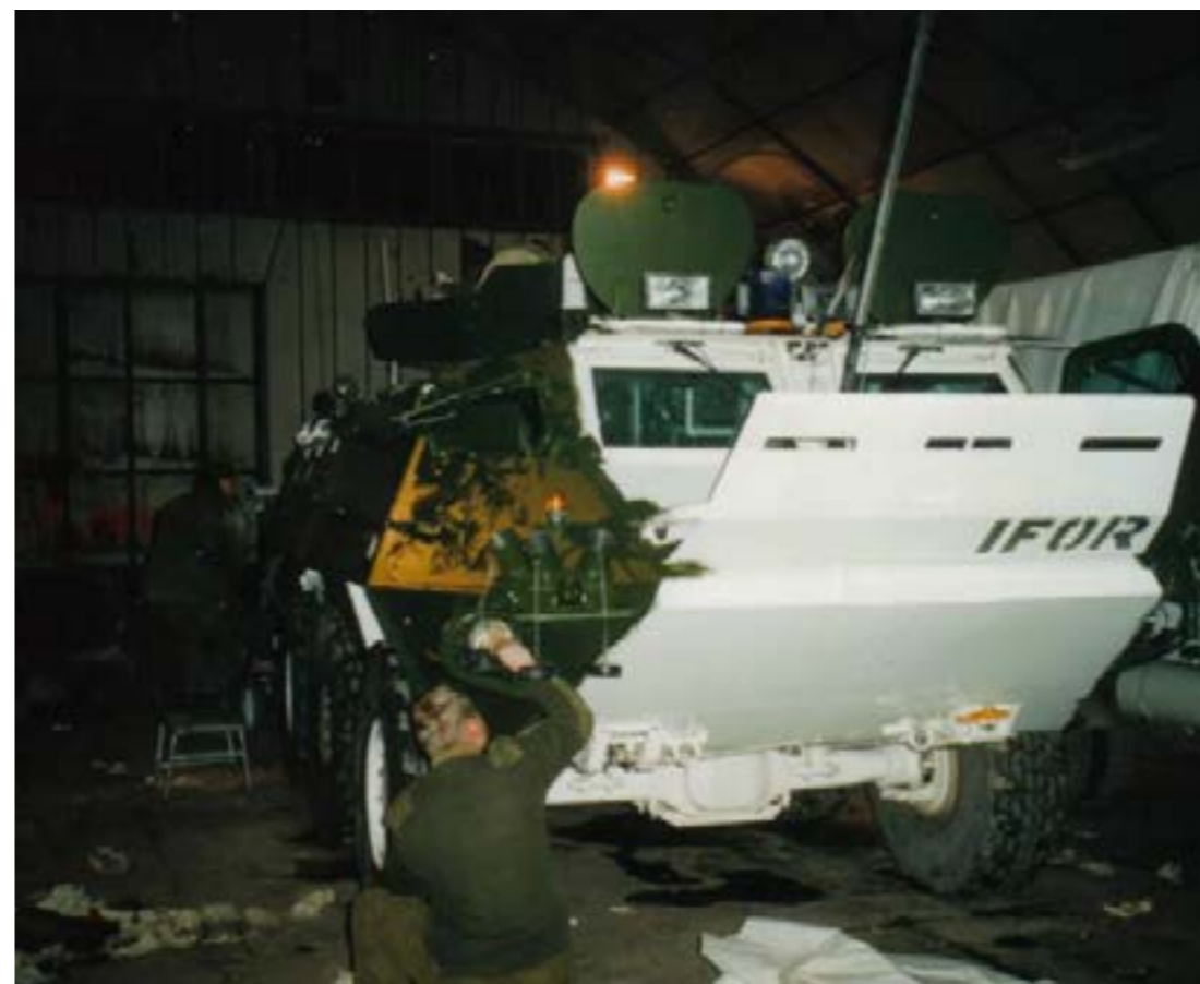
Overgang fra FN-operasjon til Nato-operasjon medførte ny maling og farge på kjøretøyene.