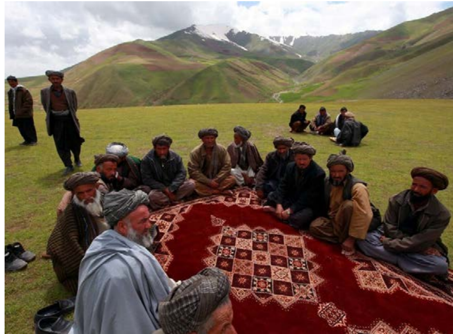
Stammeråd. Her fattes de viktigste beslutninger, uavhengig av parlament og regjering.