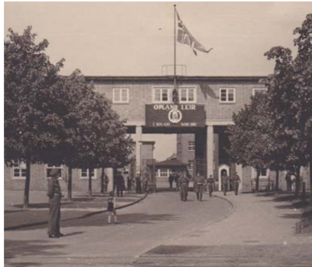
Innkjørselen til Opland Leir, Mürwik.