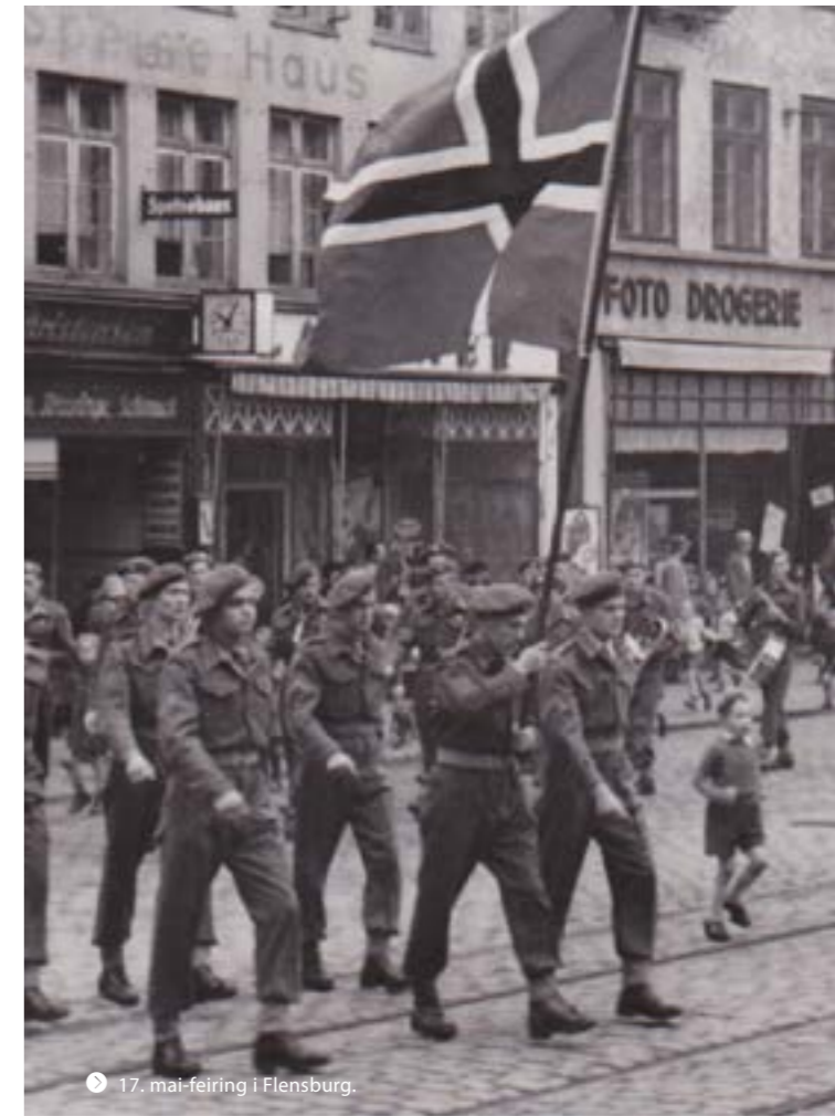
17. mai-feiring i Flensburg.