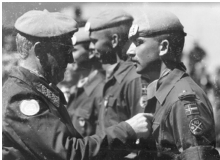
Medaljeseremoni på Steinmyra stadion i Ebel es-Saqi, Libanon.

Vi fant dessverre mannen omkommet og plukket opp levningene i et ullteppe før vi leverte det hjemme hos hans sønn. Etterpå dro vi tilbake til leiren, vasket hendene og spiste lunsj. Jeg husker jeg satt og observerte det andre befalet som hadde vært med på patruljen. Han spiste som om ingenting hadde skjedd og fortalte om