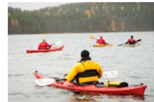
➤ Plasseringen ved Bæreiavannet gir gode muligheter for uteaktiviteter. Senteret har både kano og kajakk til utlån.