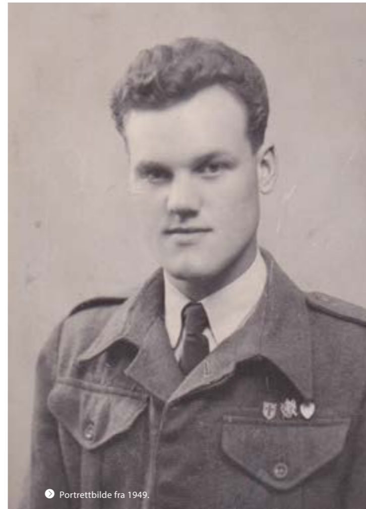
Portrettbilde fra 1949.

Les hele historien på itjenestefornorge.no