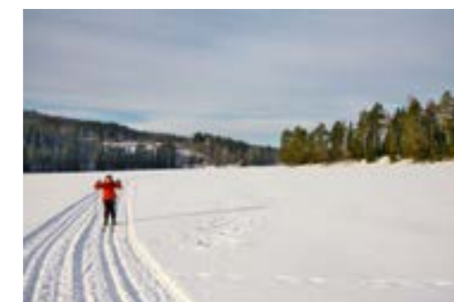
➤ Med is på vannet om vinteren kjøres det opp skiløyper. Her går du rett fra rommet og ut i løypa.