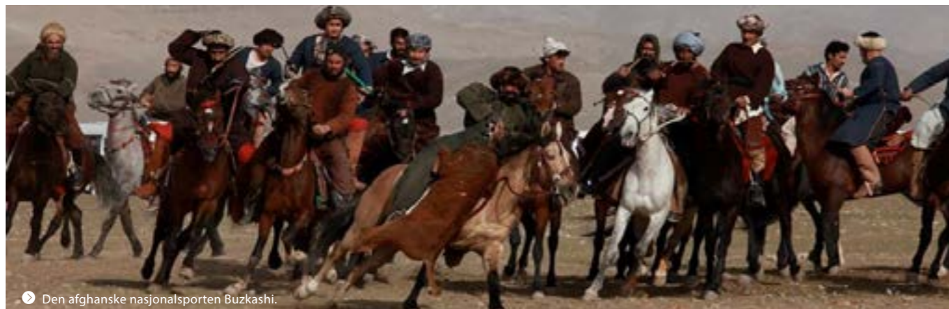
Den afghanske nasjonalsporten Buzkashi.

Da flyet lettet fra Kabul 10. juni 2013 var det som å slippe lufta ut av en ballong, og først da merket jeg at det hadde vært et krevende år. Jeg ville imidlertid aldri vært året i Afghanistan og UNAMA foruten.