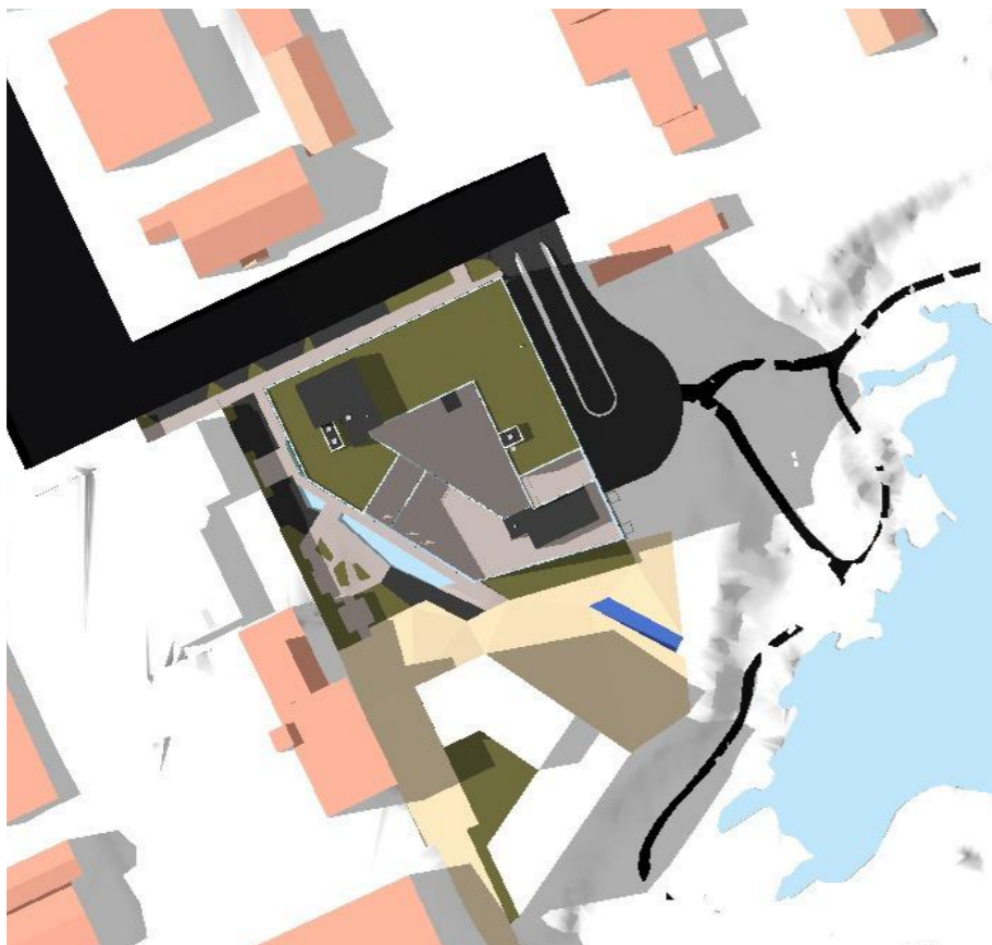
Mai 21. kl. 18:00