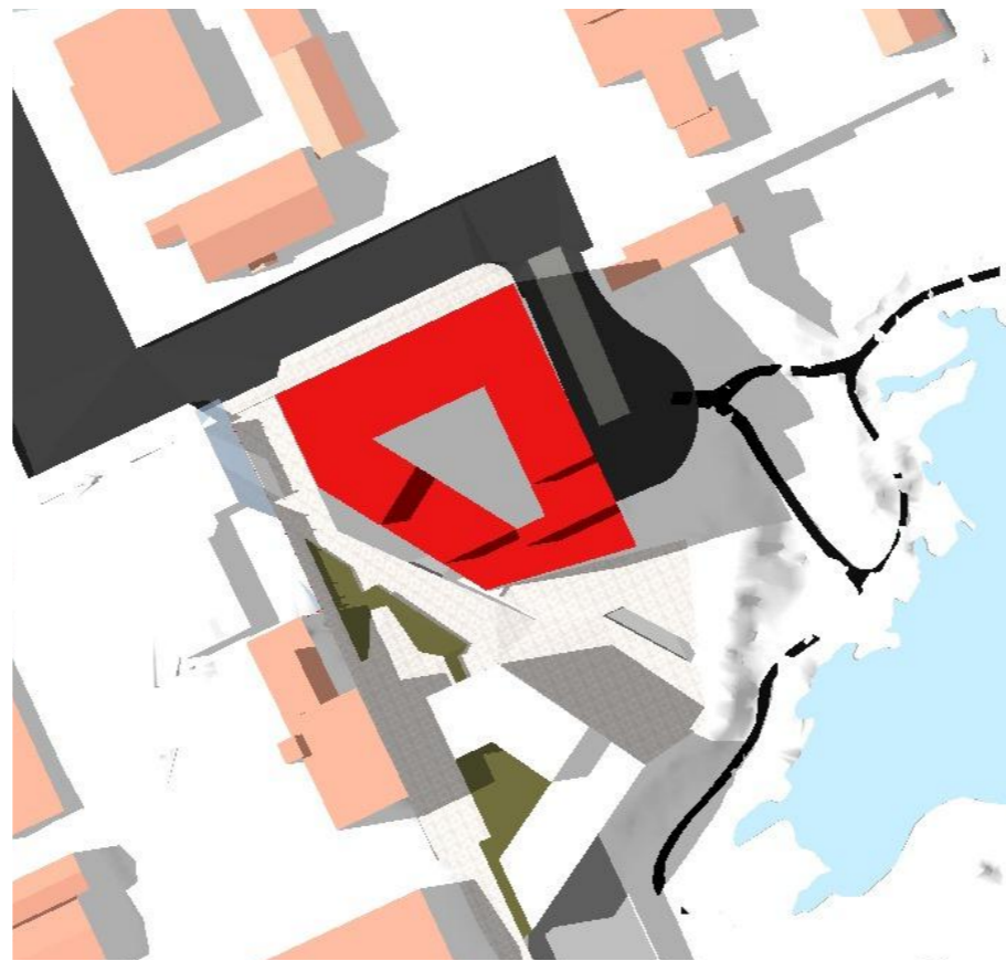
Juni 21. kl. 18:00