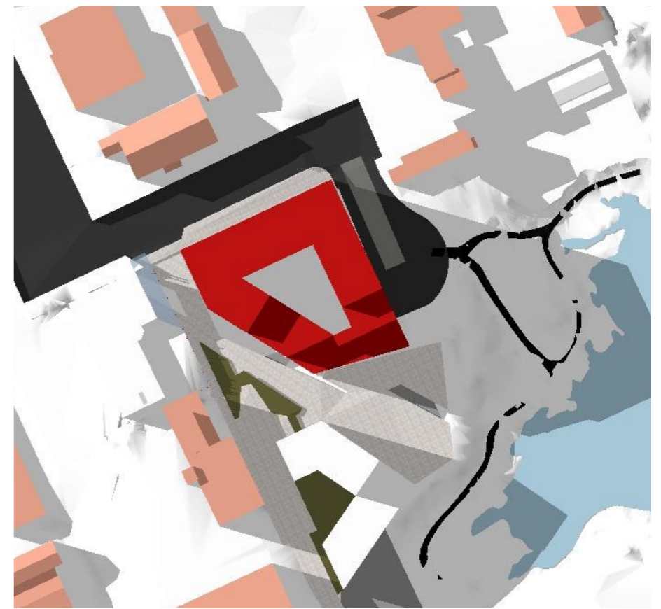
Juni 21. kl. 20:00