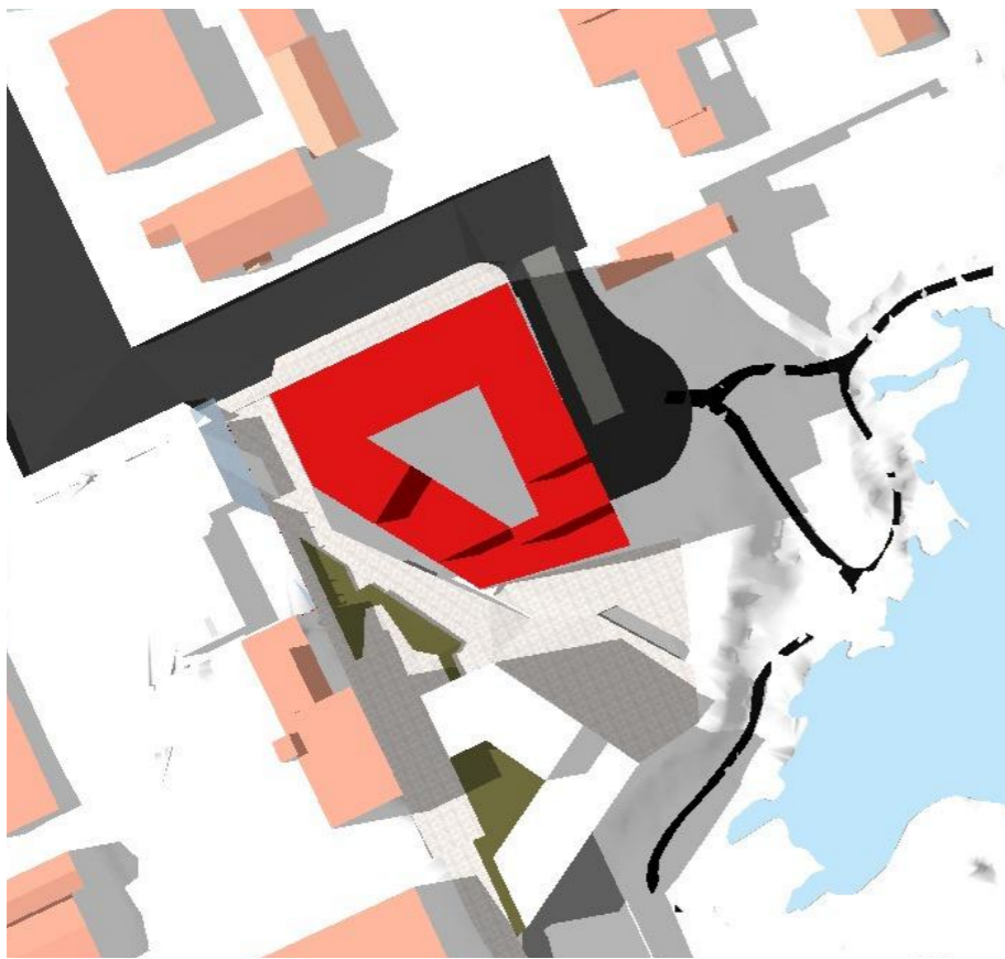
Mai 21. kl. 18:00