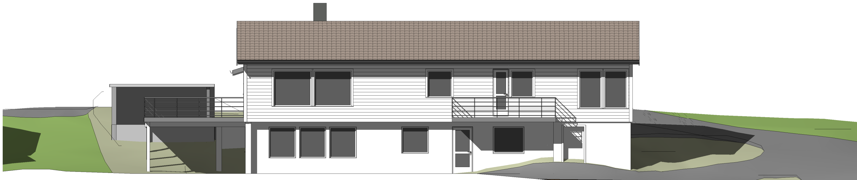
Nordøst 1 : 100