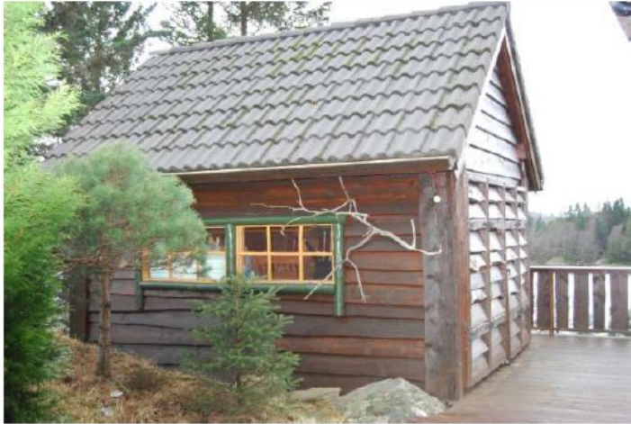
Uthus/del av terrasse sett fra øst.