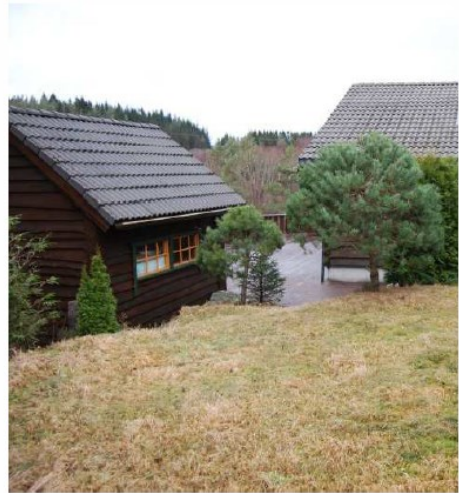
Terrasse og uthus mot terrenget i sør-øst.