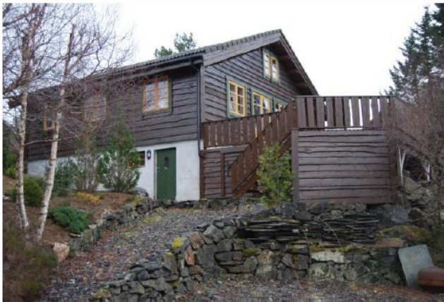
«Bunn» av parkeringsplass med tilhørende gangvei opp til hytten, sett fra nord.

Kjørbar tilkomst og biloppstillingsplass for fritidseiendommen er etablert, med parkering på egen tomt. Tiltaket er ikke tilstrekkelig omsøkt, og det har vært en viss diskusjon omkring løsningen som tiltakshaver har valgt.