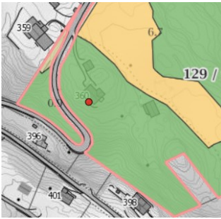
Utsnitt fra garsdkart.no (NIBIO)