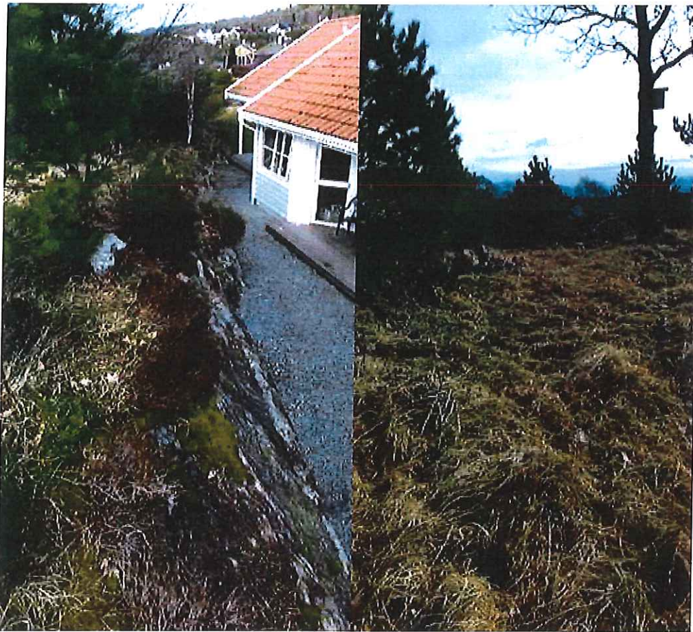
Bilde til venstre viser fjellskråningen ned mot bofelleskapet (ca 2,5-3 meter høyde forskjell) Bilde til høyre viser området vi ønsker å kjøpe, fra ca eika med fuglekassen og stykke på venstre siden.