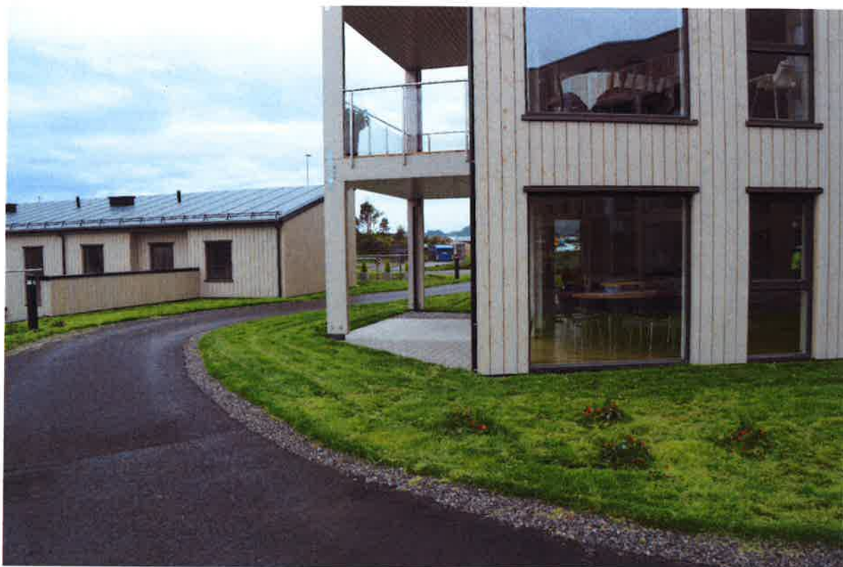
PH1 – Hageanlegg og kjørbare gangvei på sørøst siden av bygget.