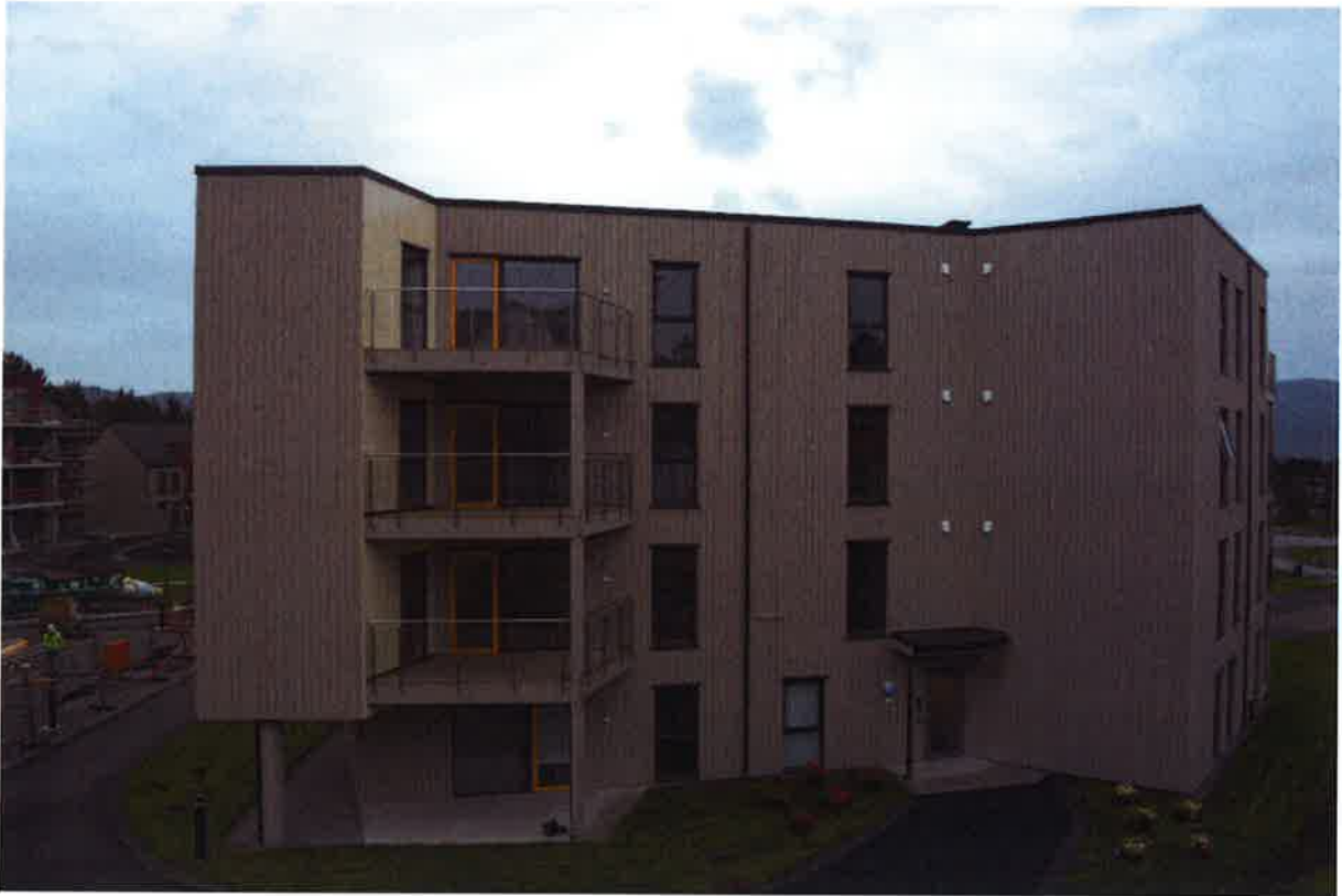
PH1 – Hageanlegg og inngangsparti på nordvest siden av bygget