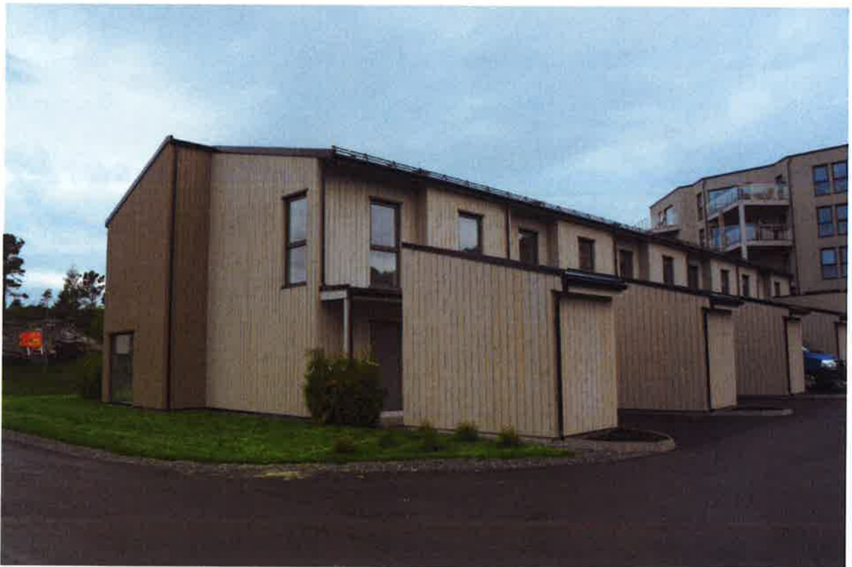
SH – Hageanlegg på sørsiden av bygget.