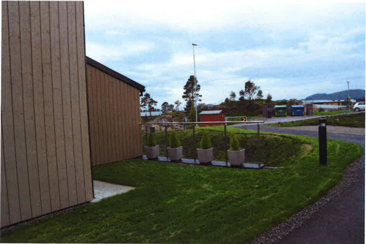
SH – Hageanlegg på nordsiden av bygget. I bakgrunnen bom og innkjøring til kjørbare gangvei.