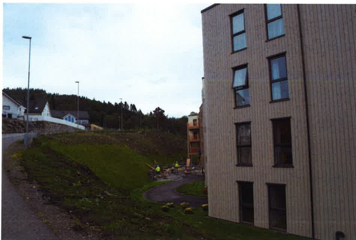
PH1 (Punkthus 1) - Hageanlegg på vestsiden av bygget