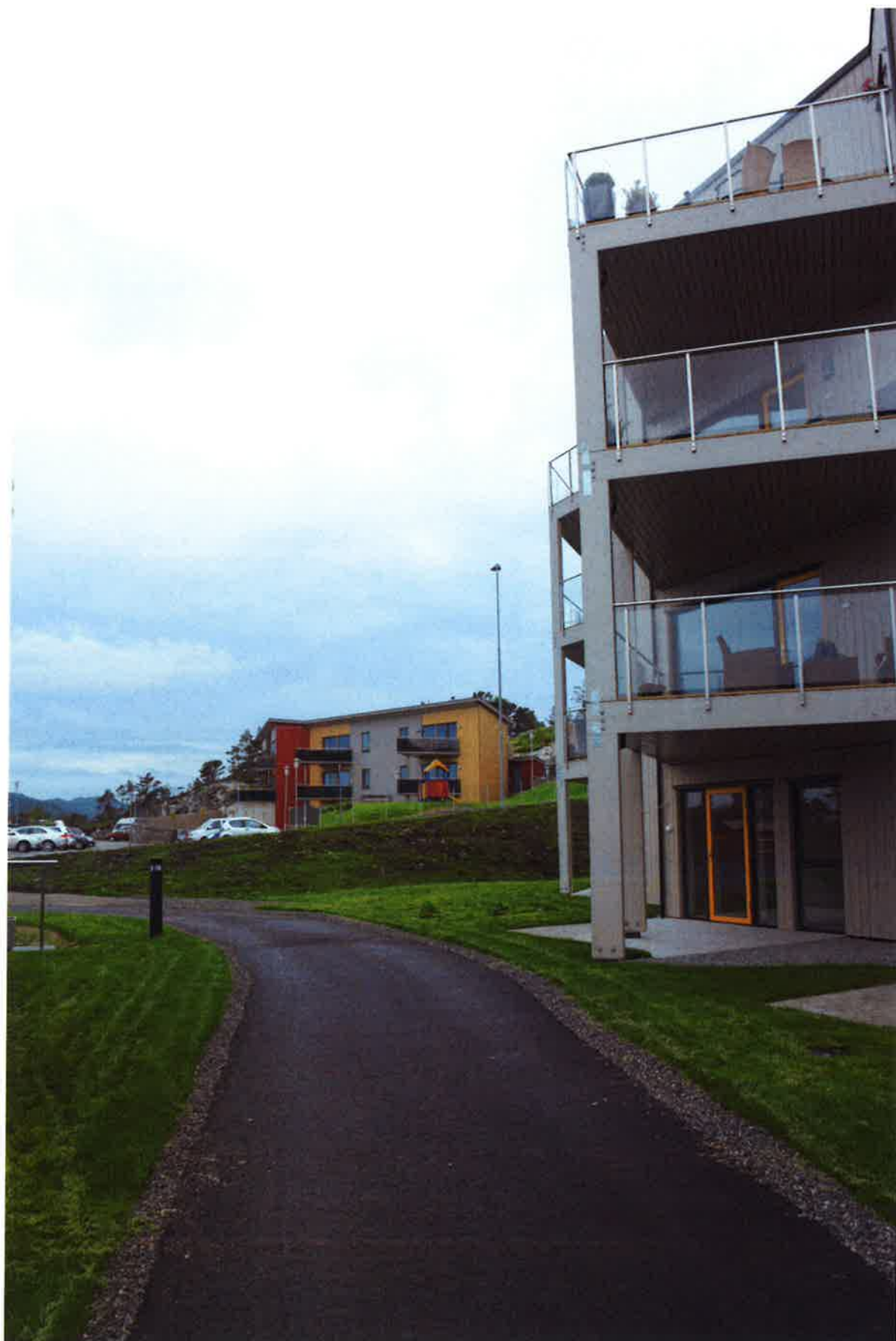
PH1 – Hageanlegg og kjørbær gangvei på sør siden av bygget.