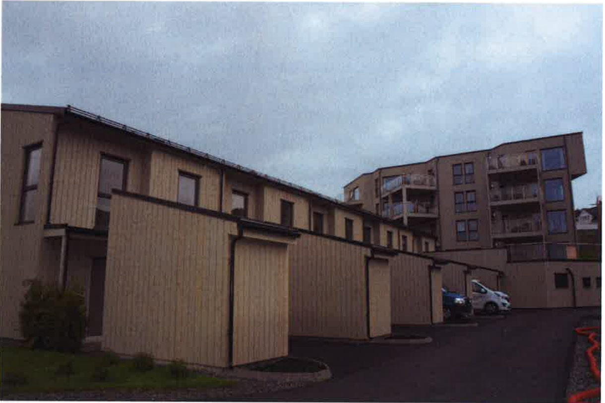
SH – Inngangsside med sportsbod og parkering og ferdig asfaltert vei inn til SH og garasje.