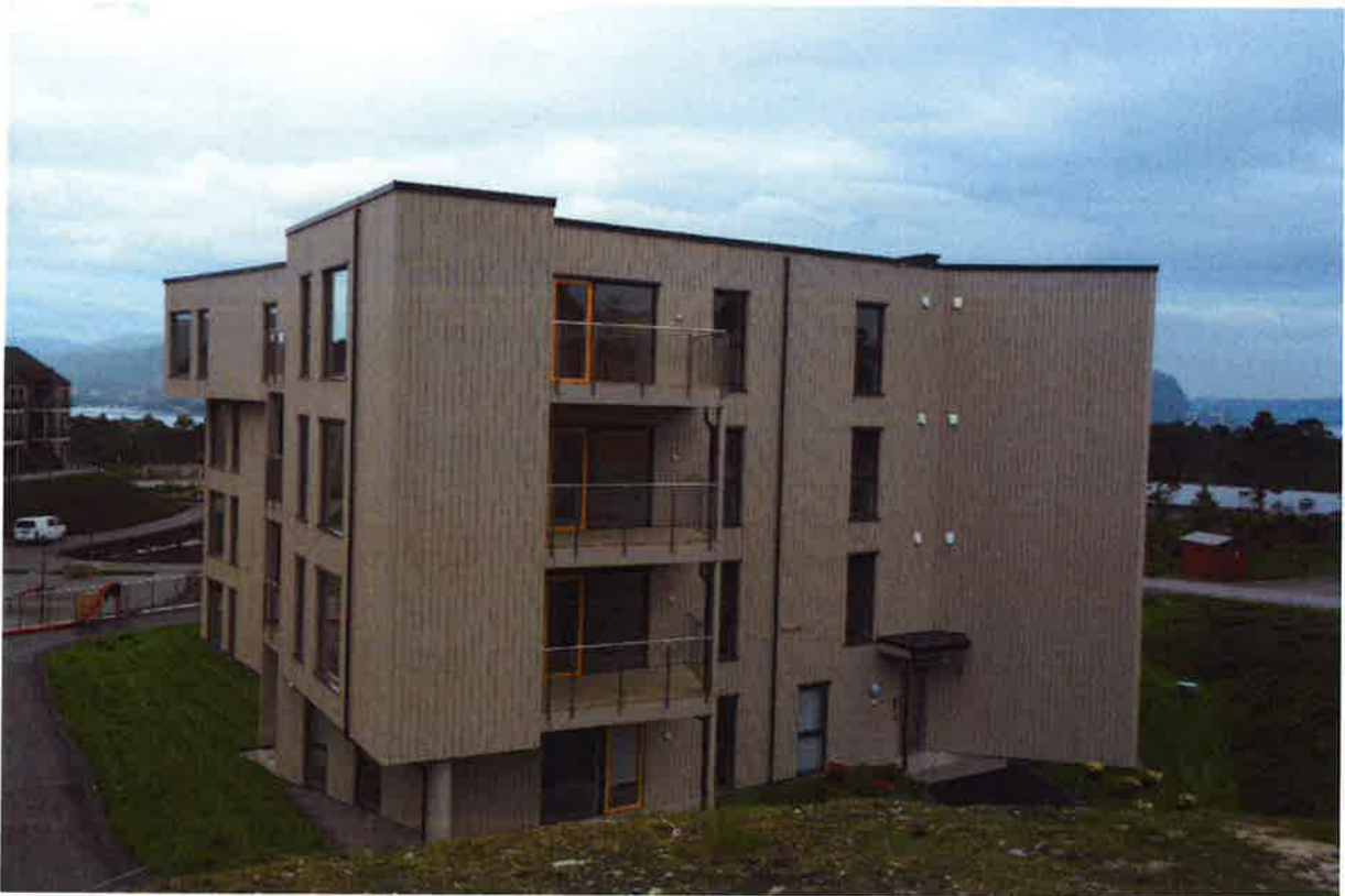
PH1 – Hageanlegg på nordvest siden og nordøst siden av bygget.