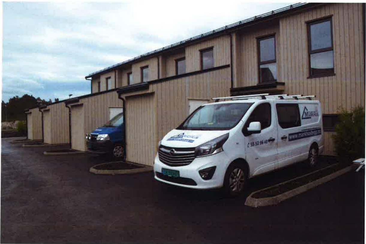
SH – Inngangsside med sportsbod og parkering og ferdig asfaltert vei inn til SH og garasje.