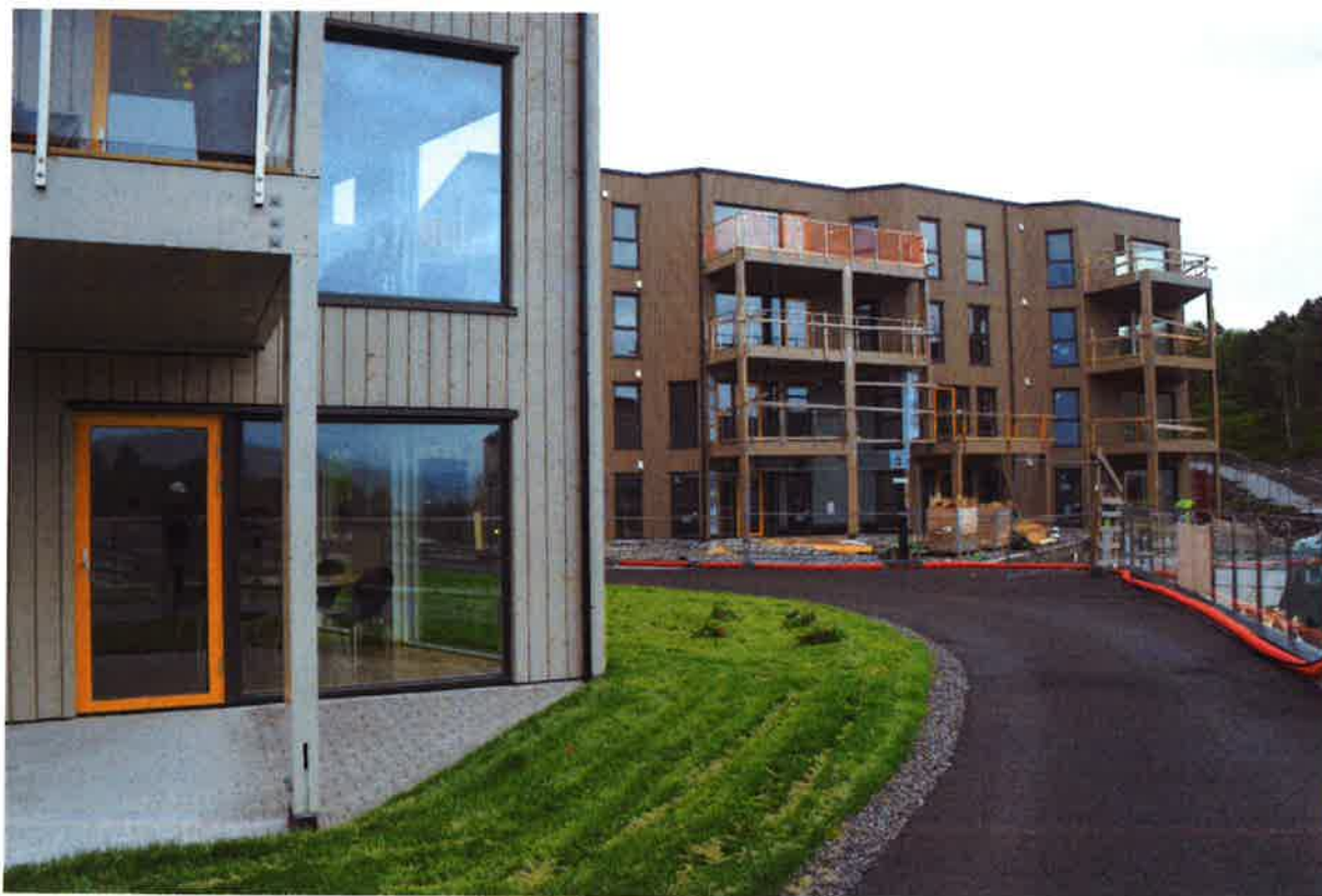
PH1 – Hageanlegg og kjørbare gangvei på sør siden av bygget. PH2 i bakgrunnen med bygge gjerde sikring .