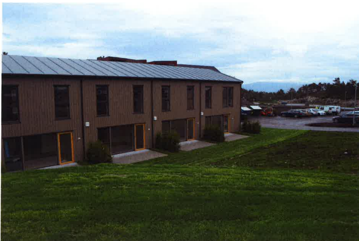
SH (Småhus) – Hageanlegg på vestsiden av bygget.