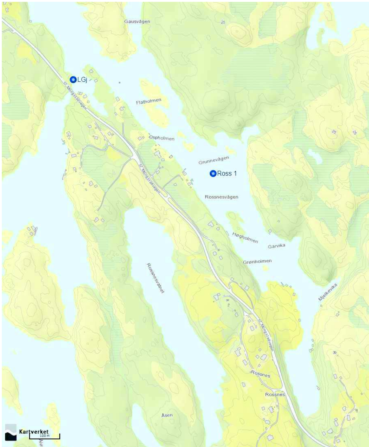
Figur 0 Oversikt over undersøkningsområdet med prøveinnsamlingsstasjon (Ross 1) og stasjon for semikvantitativ undersøkning (LGj) markert. Kartkilde: Kartverket

Kart over undersøkningsområdet med stasjonsplasseringar vist under (Figur 1.1).