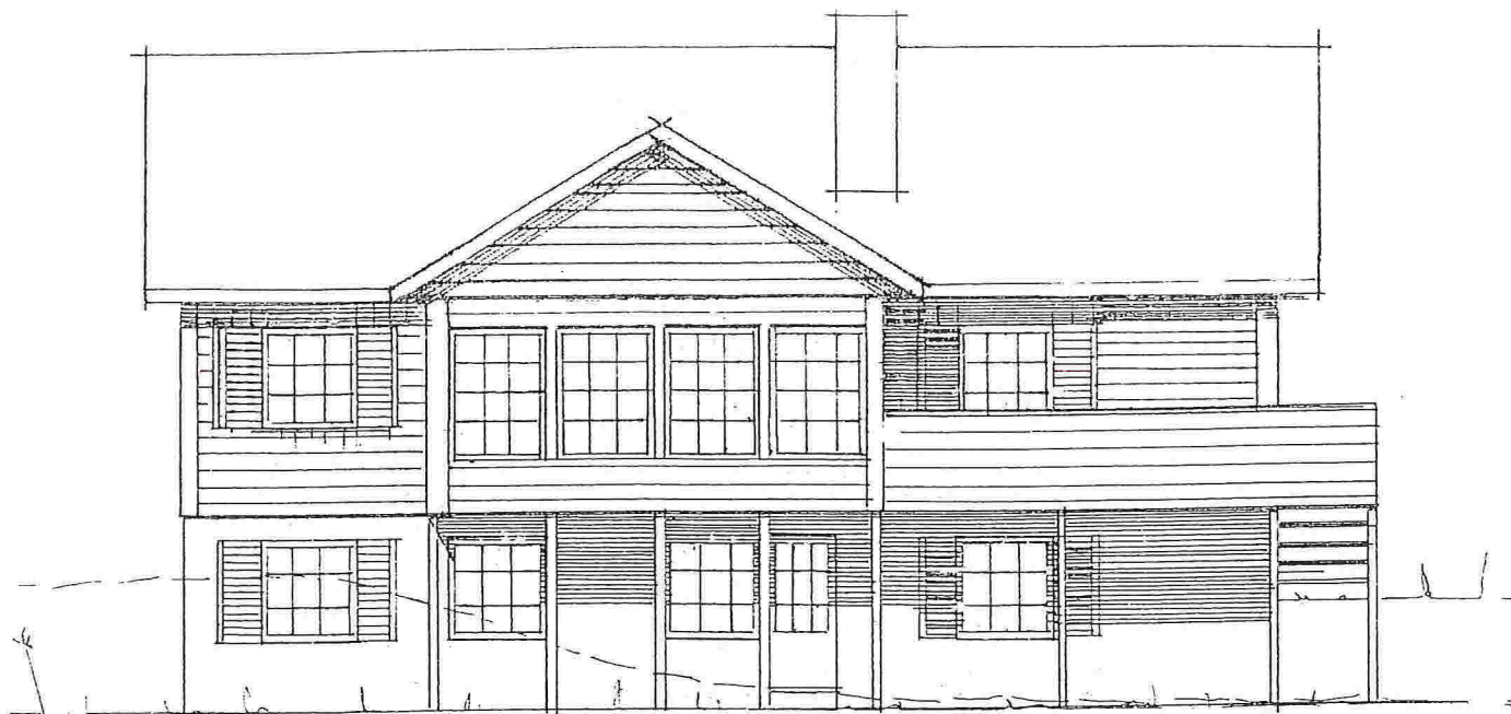
Nåværende fasade mot Syd - Vest