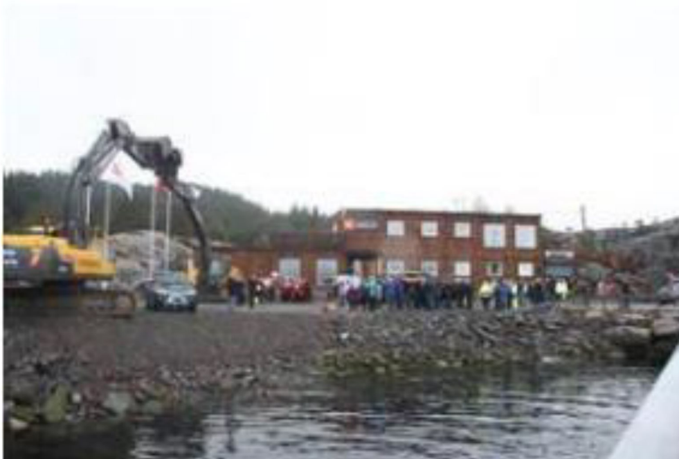
Figur 3: Næringsutvikling i Gulen, her illustrert ved opning av Skipavika Næringspark.

Gode og tilstrekkelege areal for næringsutvikling: I samfunnsdelen er eit mål å utvikle fleire lønsame og varierte arbeidsplassar. Å leggje til rette for næringsutvikling er også sentralt i målet om å skape aktivitet og vekst i folketal i kommunen. Trendar og behov for areal for næringsutvikling er i endring, og areal sett av til næringsverksemd på land eller i tilknytning til sjø vil vere eit viktig punkt å ta med inn i ny arealdel, for å oppdatere den ut ifrå endra behov.