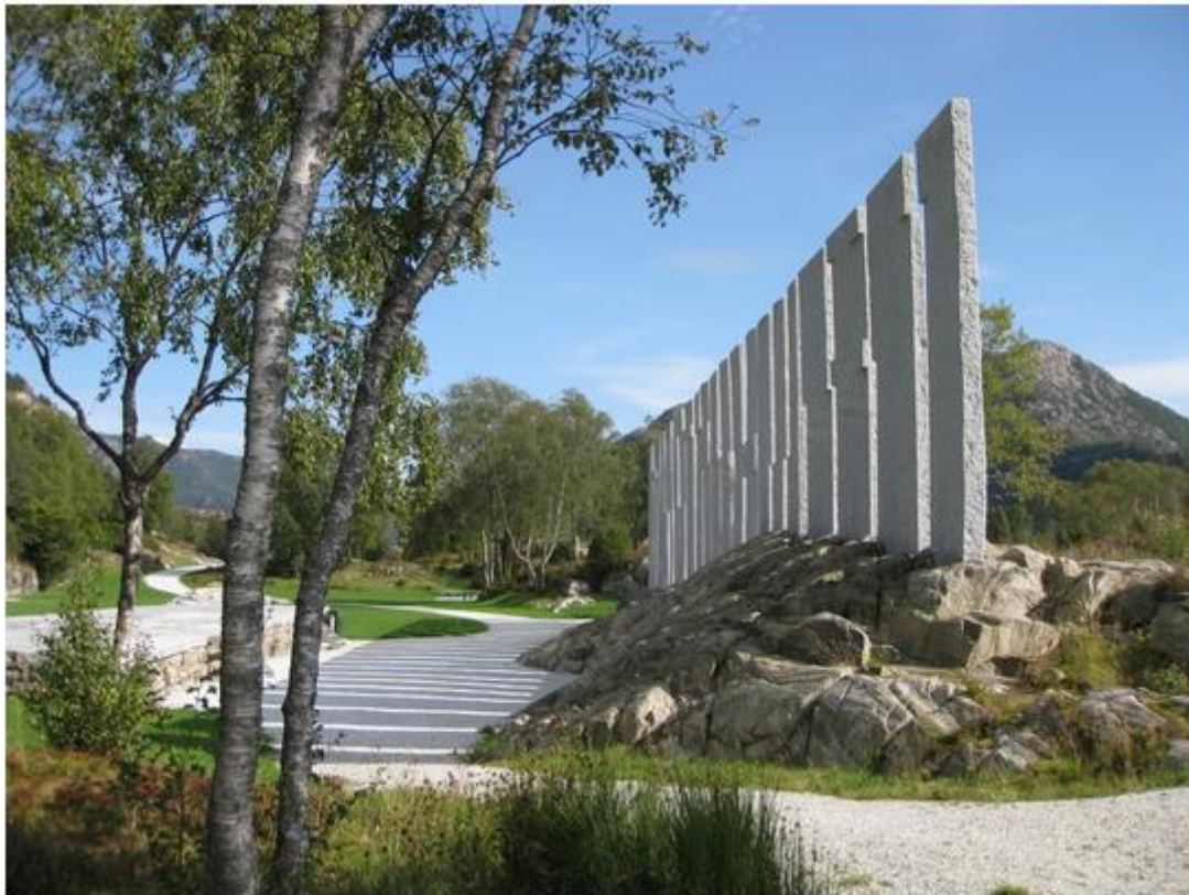
Figur 1: Gulathingstaden på Flolid.

I planprosessen vil medverknad og samarbeid med interessentar, innbyggjarar, næringsliv og andre rørte partar, mellom andre barn og unge, vere viktig. Forslag til tiltak og aktivitetar for å auke grad av medverknad vert omtala i eige avsnitt.