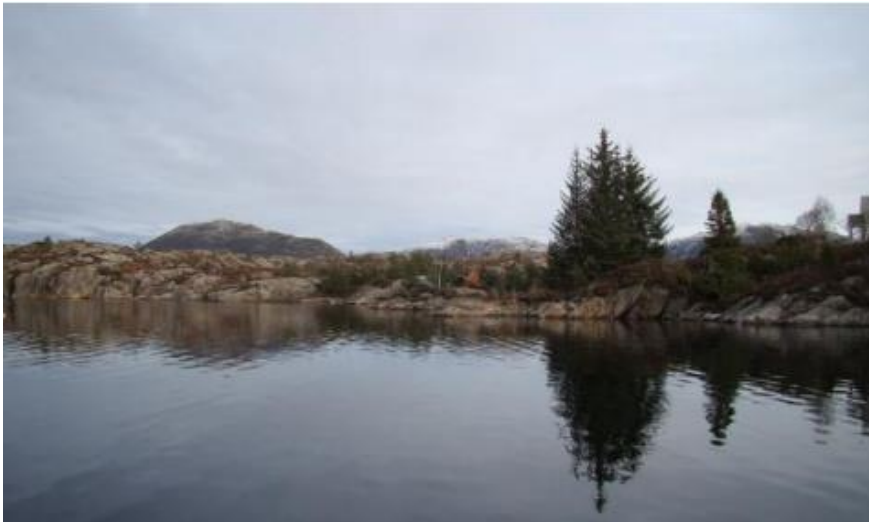
Figur 4: Eksempel på ubygd strandsona. Kjelde: Norconsult 2011, Strandsoneanalyse for Gulen kommune

Område for bygging i strandsona: Kommuneplanen fastset bestemte område der det er opna for bygging i strandsona, der byggegrensa mot sjø er mindre enn 100 meter. Ved rullering av kommuneplan bør det takast opp til vurdering om, korleis og i kva for grad område med byggegrense mot sjø på mindre enn 100 meter skal vidareførast eller endrast.