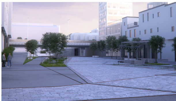
Lys granitt i sjølve gangsoner står i kontrast til mørkare felt med granitt/steindekke i møbleringssone.

Granitt er i tillegg tenkt brukt i trapper og mindre kantar/murer.