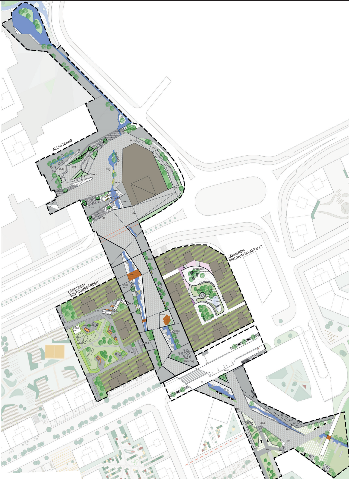
Nedskalert illustrasjon av landskapsplan LO 001. Sjå vedlegg for plan i målestokk.