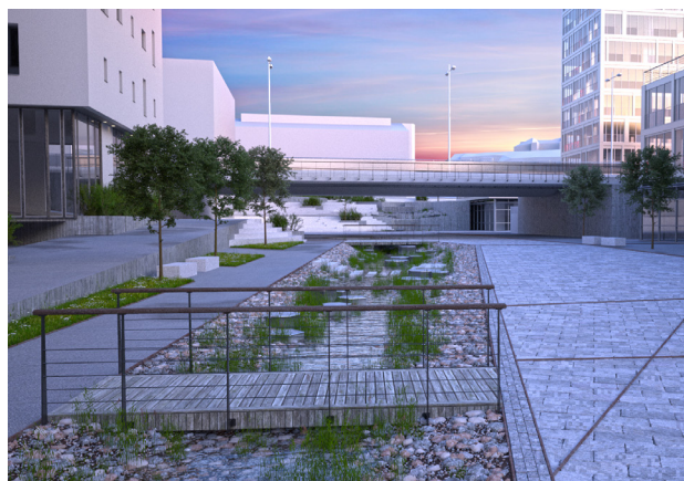
Vasskantvegetasjon og elvestein i elveleie.

For å unngå meir tilsig til eit rørledningsnett som allereie har for stor belastning, skal alt overvatn handsamast i dagen. Det er naturleg å sjå overflatevatn og opninga av Lonena i samanheng, og løyse dette i ein felles plan. Kvassnesstemma har i dag for lite tilsig av vatn, og vil med jamne mellomrom tørke delvis ut, noko som skaper dårleg lukt, og utsjånad. Dette verkar i dag negativt på opplevingskarakteren på grøntområdet. Opning av Loneelva og open handtering av overvann vil auke vasstilsiget, og betre denne situasjonen.