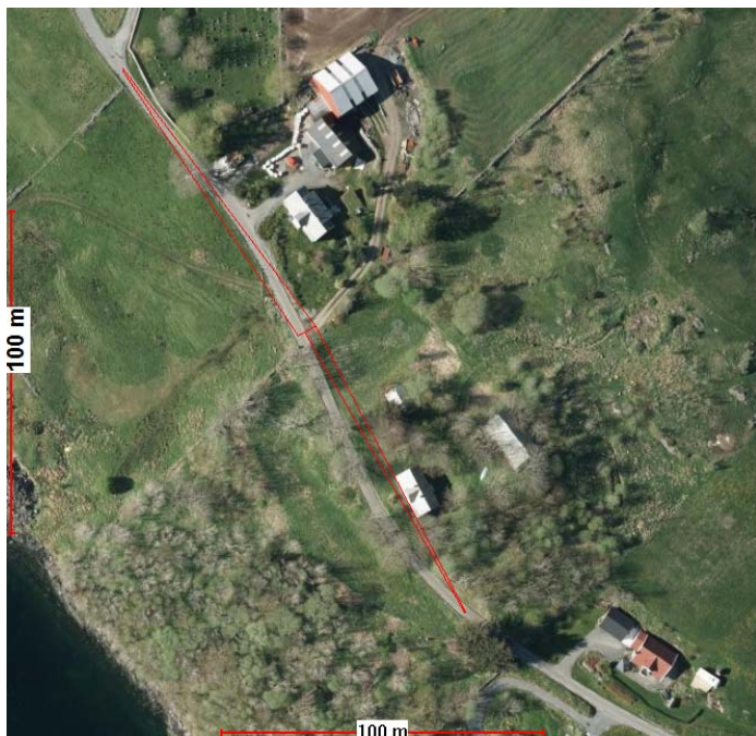
Illustrasjon siktlinjer 100m.

Eit absolutt krav vi stiller til nye avkøyrslø eller ved søknad om utvida bruk av eksisterande avkøyrslø er at det skal vere tilstrekkeleg sikt. Siktkravet i dette tilfellet vil vere at ein skal sjå 100 meter til kvar side av køyrebanen frå eit augepunkt 1,1 meter over bakken 4 meter inn i avkøyrsla. På synfaring målte vi at sikta ikkje er tilfredstillande. Sikta vart målt til rundt 60 meter i begge retningar. Dette er vesentleg under siktkravet som gjeld for ei fartsgrense 80 km/t.