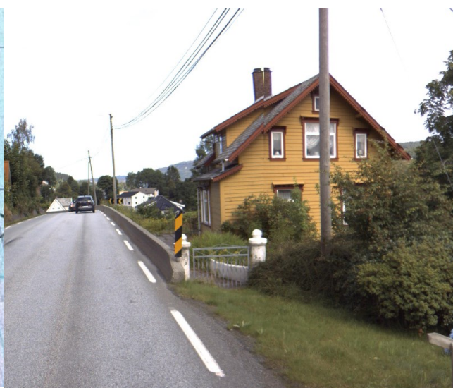
Vegbilde frå staden som viser dagens tilkomst.

Utsnitt av kartet over viser at huset ligg tett på fylkesvegen. Det er i dag gangtilkomst til huset som går via ein port som ligg parallelt med fylkesvegen. Det er krevjande forhold på tomte med bratt terreng og stor høgdeskilnad mellom tomte og fylkesvegen. Det er relativt kort