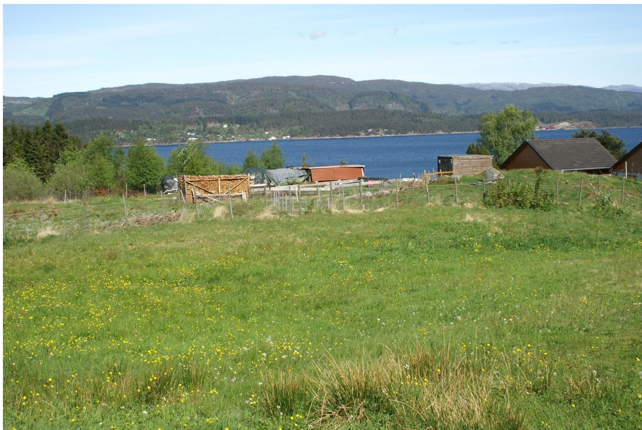
Innmark på bnr. 10 som er del av planområdet

I omsynssona skal interesser knytt til landbruk ha særskilt vern.