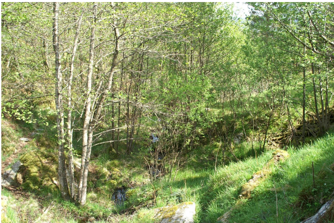
Bekken som renn gjennom området (midt i bilde).

Vår konklusjon er at område ikkje er attraktivt for eit større omland, men i første rekkje har kvalitetar som må utviklast og nyttast til rekreasjon og leik for dei som bur i, og kjem til å bu i planområdet.