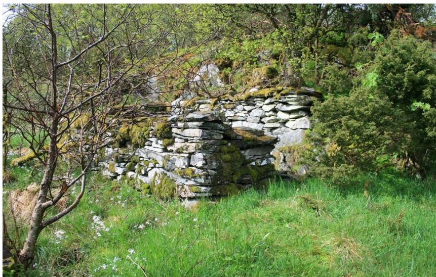
rundt 1890 og er i dag del av Fv 404.

Innafor reguleringsområdet er det få synlege restar etter tidlegare drift og bruk av landskapet. Det står murrestar etter det som har vore gardflor på bnr. 3. Tidspunkt for oppføring er ukjent.