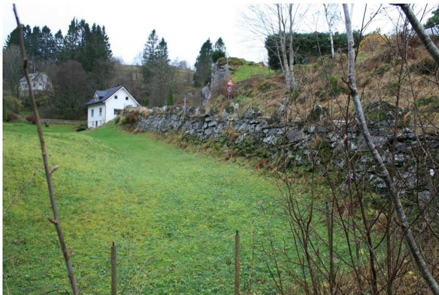
Figur 1 Fylkesveg - mur

Bnr. 3 vart oppretta 1849 utskilt frå bnr. 2.