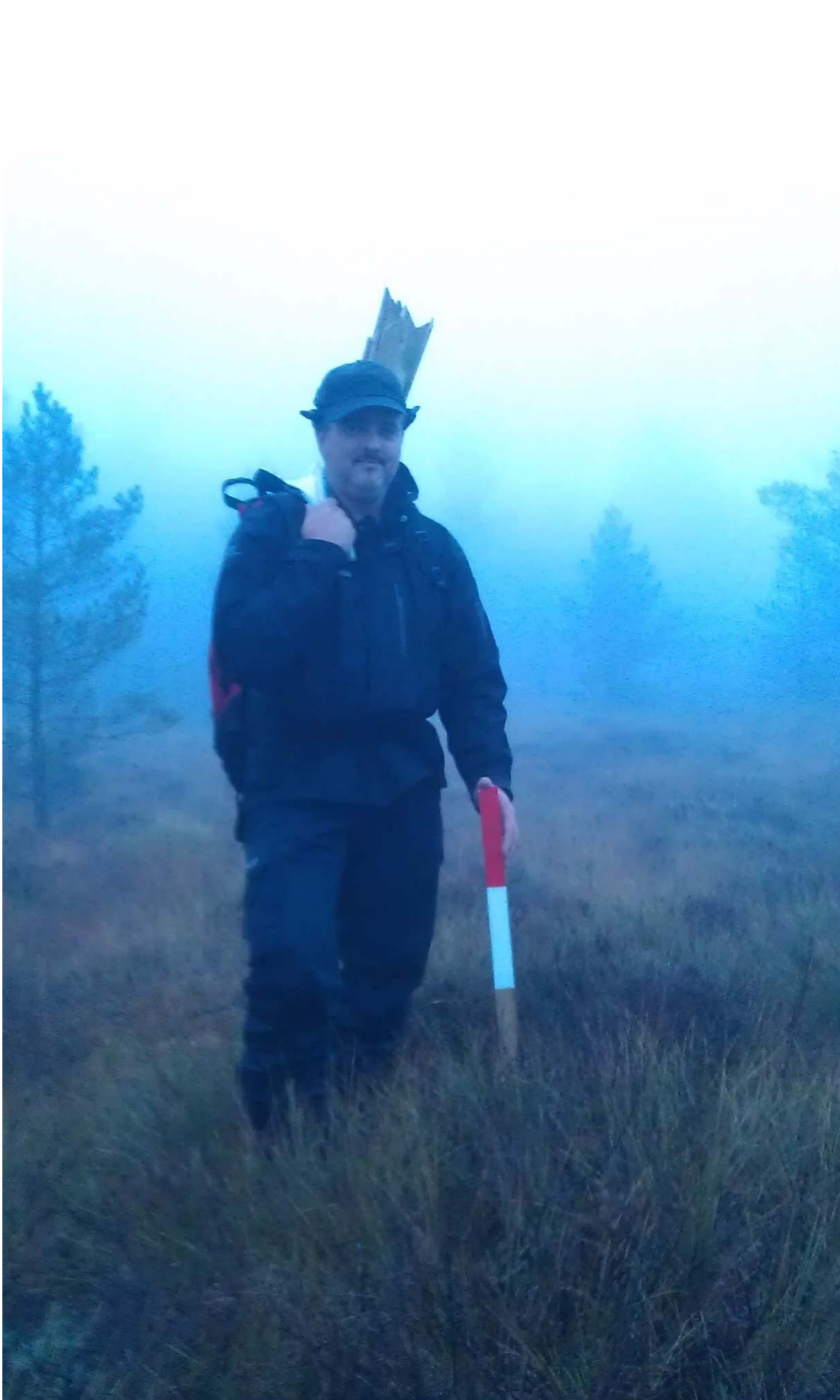
Montering av merkepinner og skilt ute i terrenget.