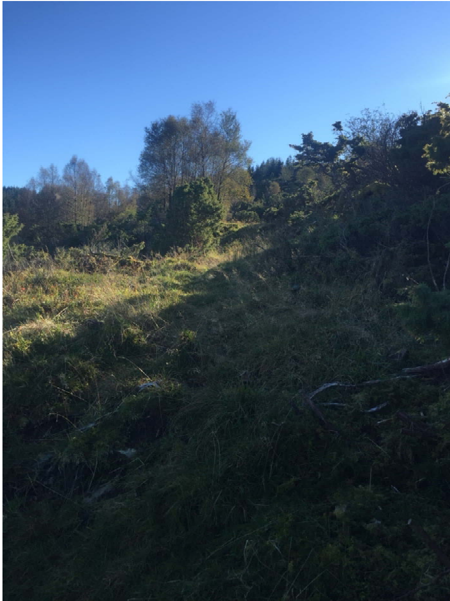
Det veks fint grønt gras mange stader i stien no.