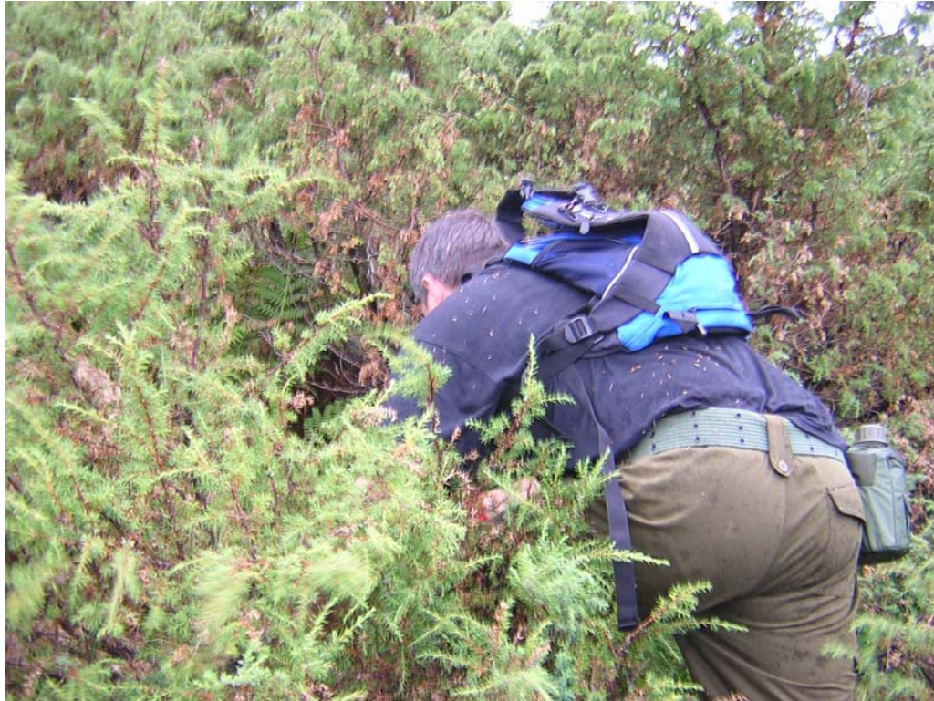
Her kan ein sjå kor tett sprakebuskene står.