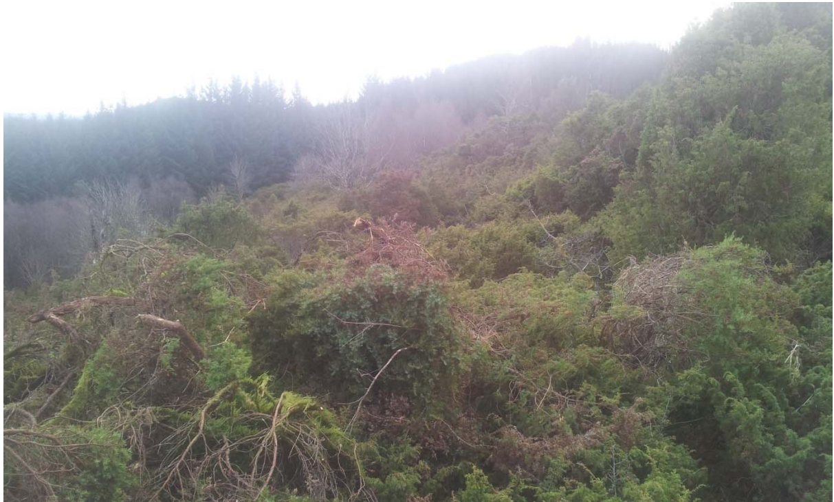
Mykje stor og tung brakje har blitt skore ned, og fjerna mykje av røtene.