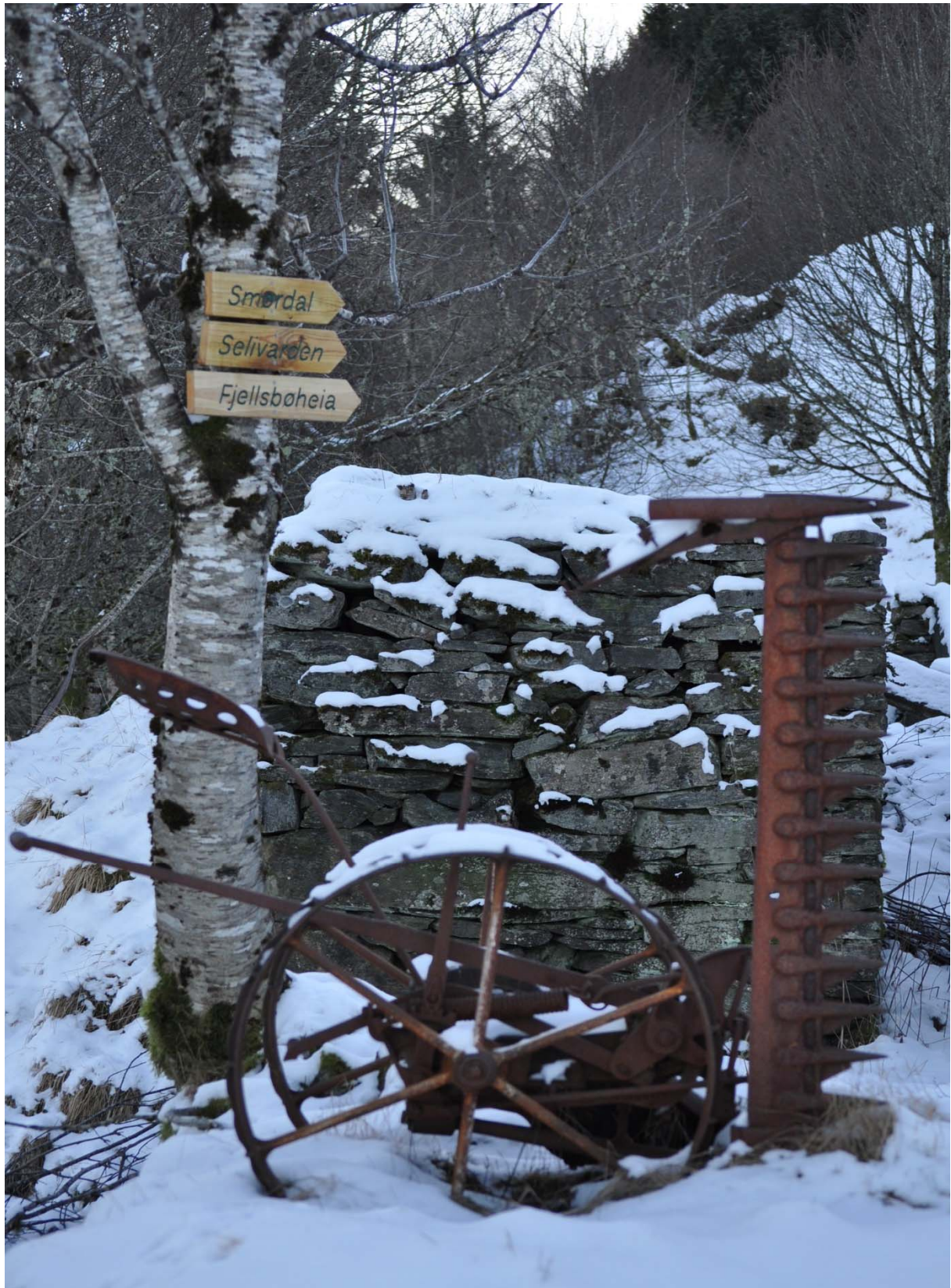
Mange skilt er produsert og satt opp ute langs stien. Gamle stadsnavn har også vorte satt opp rundt om kring langs stien. Desse skilta står ved snuplassen oppe på Vefjell.