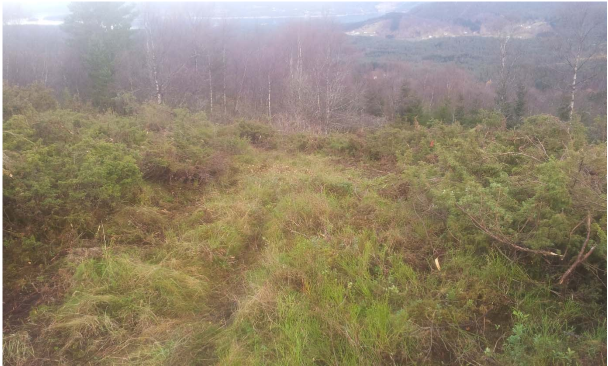
Her har mykje brakje vorte revet opp med rota. Bredda på stien er ca fire meter mange plasser.