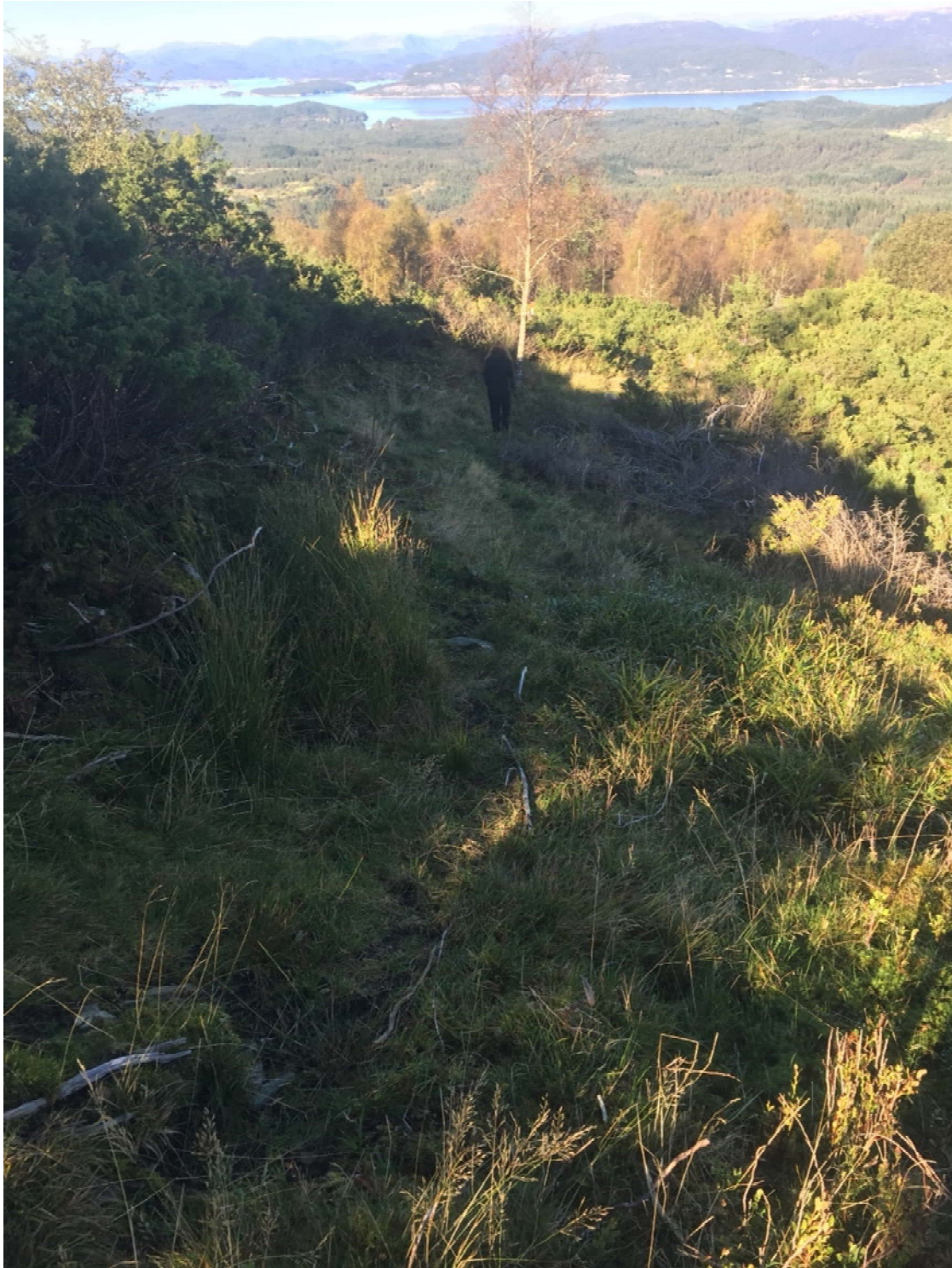
Bilete frå sien. Her har me fjerna spraken, og dradd opp røtene for å få marka flatare. Vatnet drenerer betre også når røtene vert dradd opp.