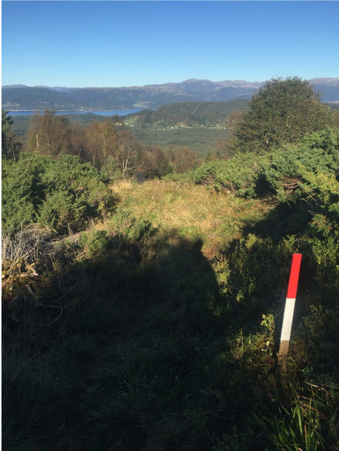
God bredde på stien, og god merking.