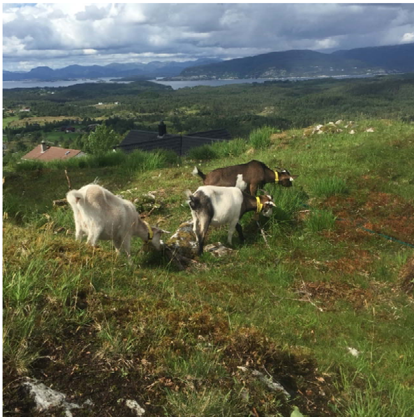
Utsikt frå Vefjell.