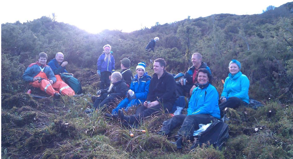
Ein god dugnadsgjeng 3/11-2013