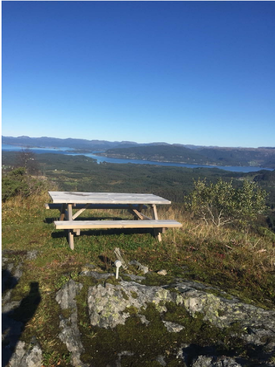
Ein rastebenk er kjøpt inn og montert oppe på «Førkammen». Eit flott utsiktspunkt ca halvvegs på turen.