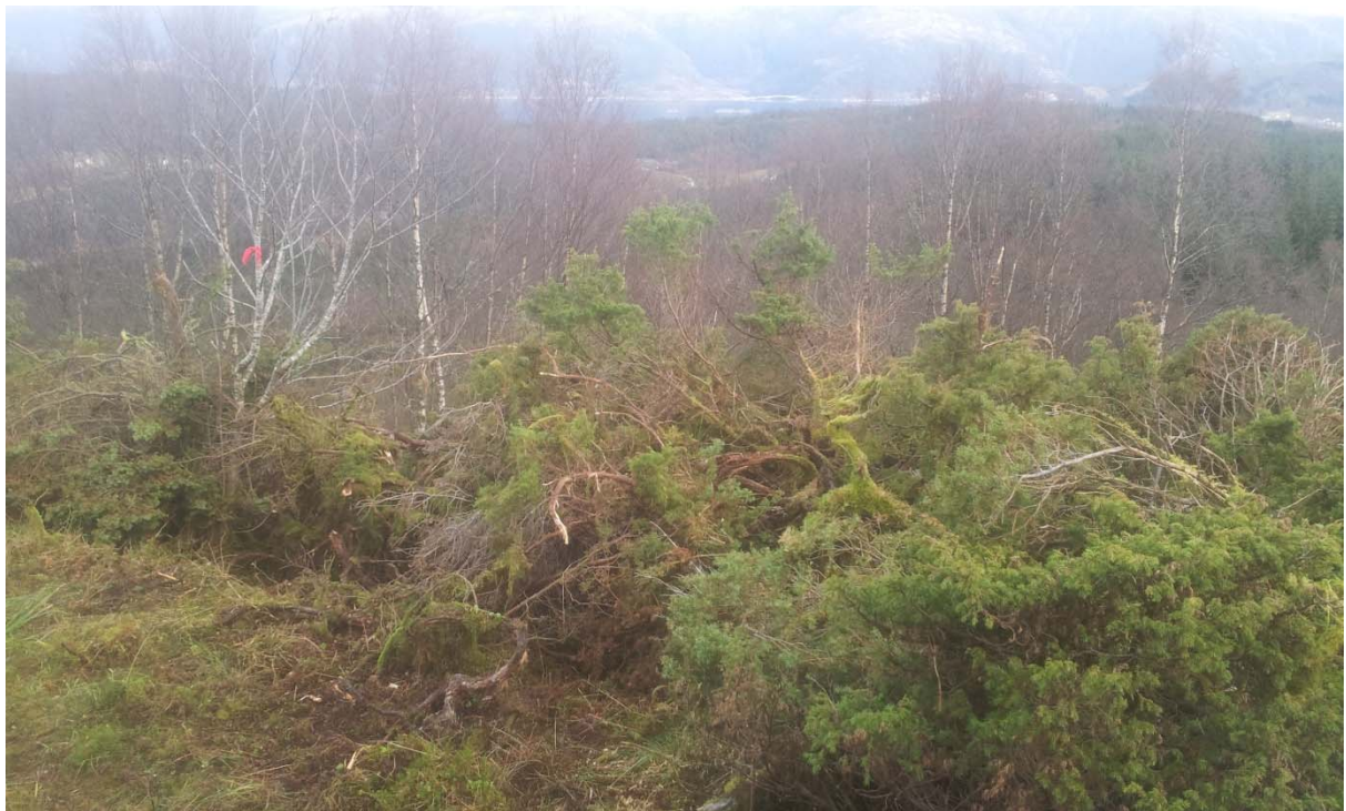
Nede i venstre hjørne, viser litt av den ferdig rydda vegen. Store hauga med brakje har vorte lempa på.