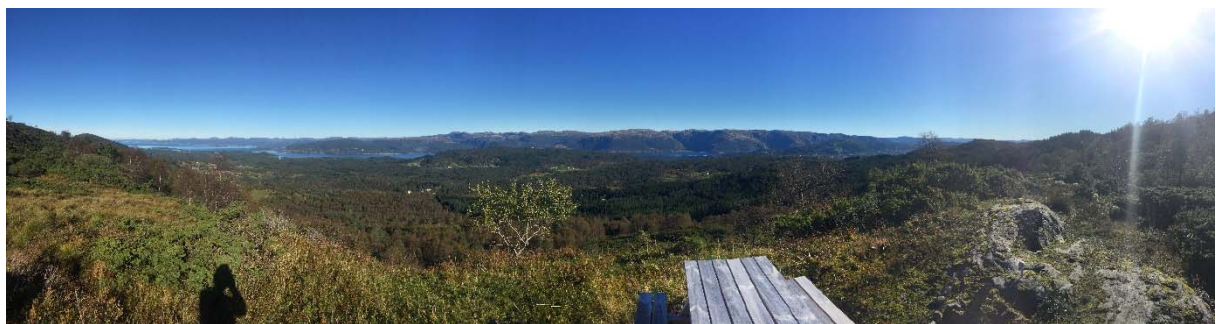
Panorama bilete tatt frå Førkammen.