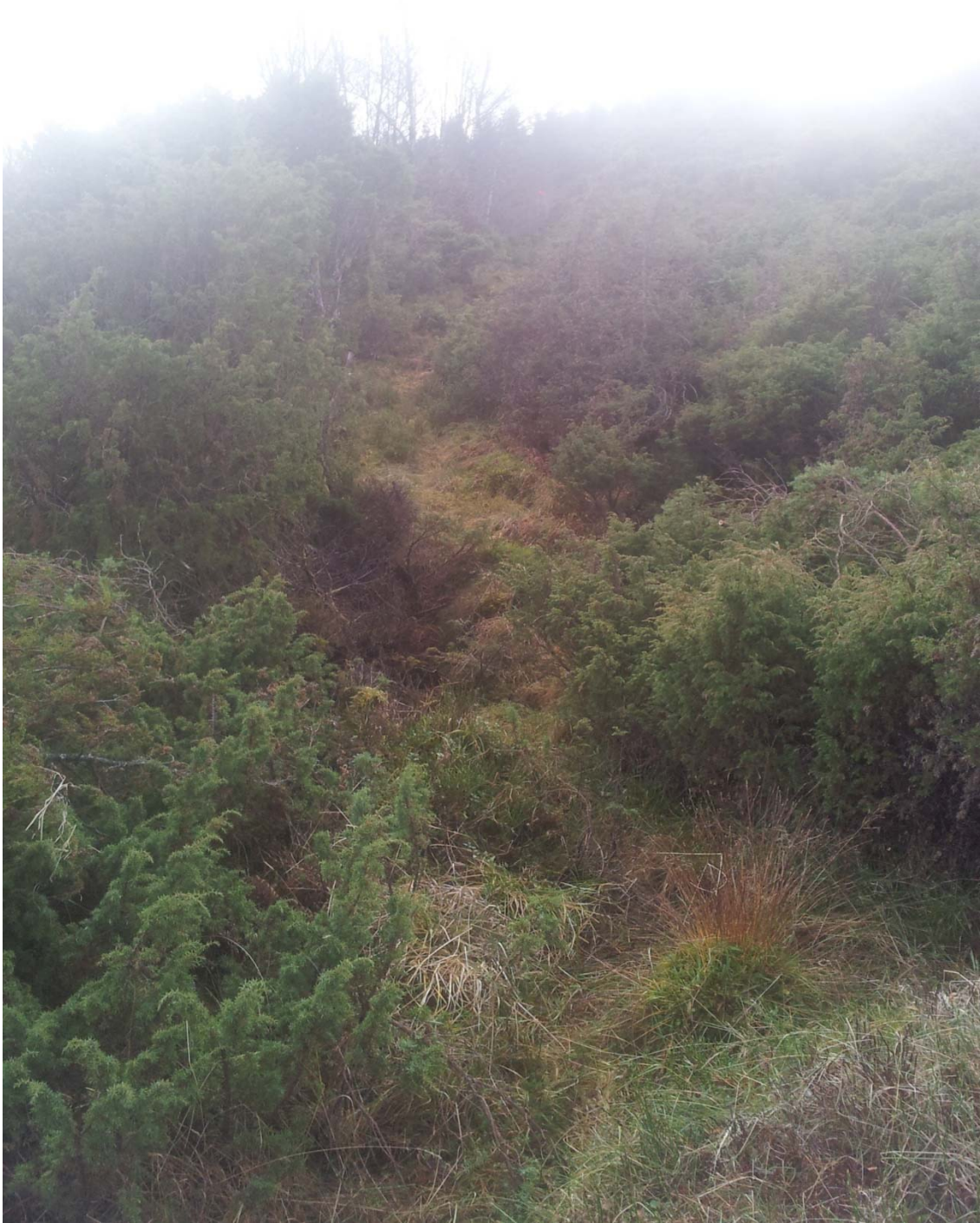
Her er bilete frå sånn som stien såg ut før me opna opp ei bredde på ca fire meter.