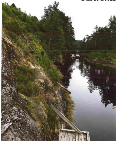
Området sett mot sør fra gnr 89 bnr 23