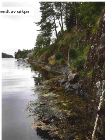
Området sett mot nord fra gnr 89 bnr 24