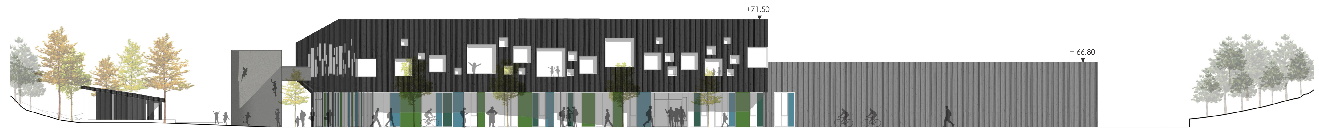
FASADE SØR MÅLESTOKK 1:200