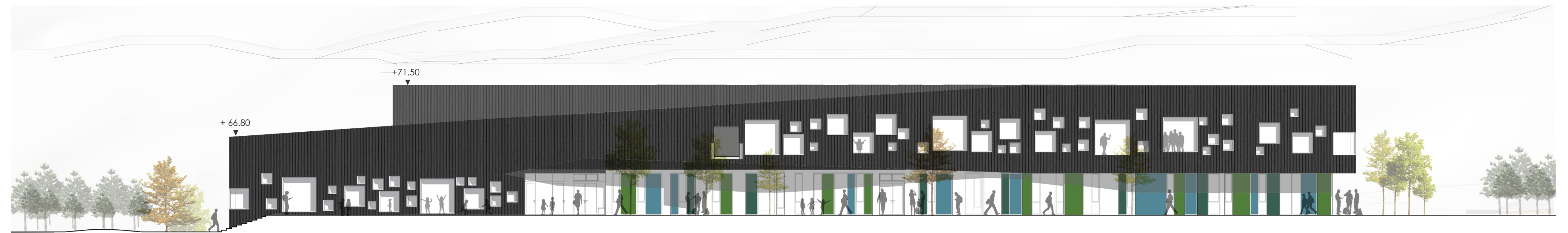
FASADE VEST MÅLESTOKK 1:200