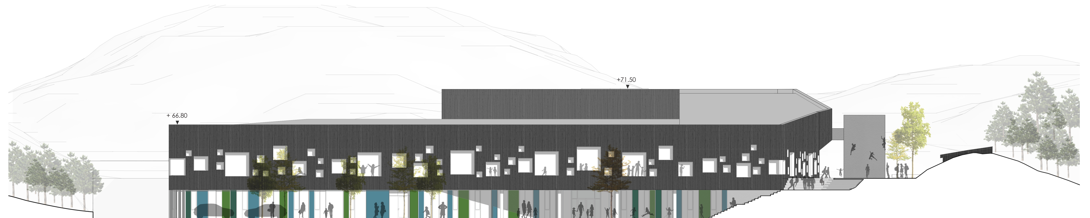
FASADE NORD MÅLESTOKK 1:200