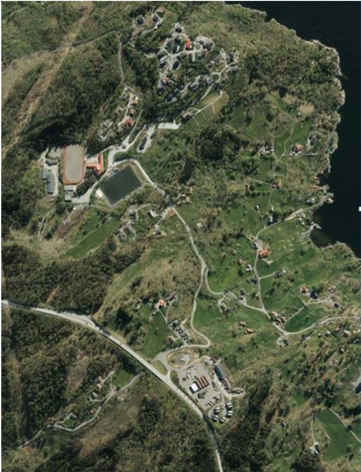
Figur 2 Skråfoto av Ostereidet - merk at bilete viser eit større område enn planavgrensninga