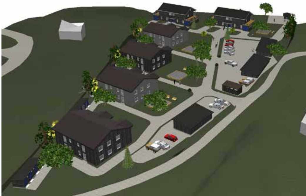
Figur 1 - Illustrasjon av området for konsentrert busetnad- der det foregår arbeid

Vi vonar at kommunen ser at saka handlar om infrastrukturen i eit godkjent regulert byggjefelt. Det vert sendt inn egne byggjesøknader knytt til dei enkelte husa i området.