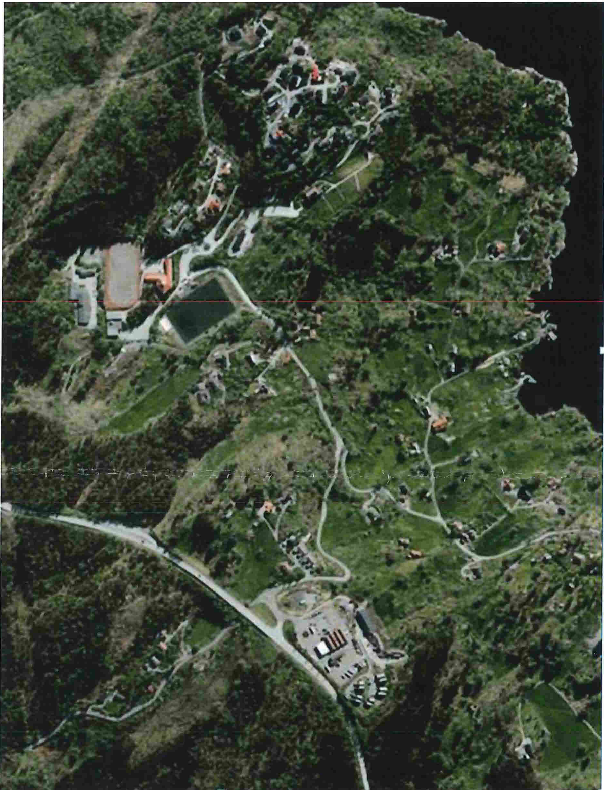
Figur 2 Skråfoto av Ostereidet - merk at bilete viser eit større område enn planavgrensninga