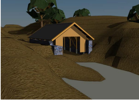
Omsøkt gjenreising av naust (Sjå vedlegg for fleire teikningar)