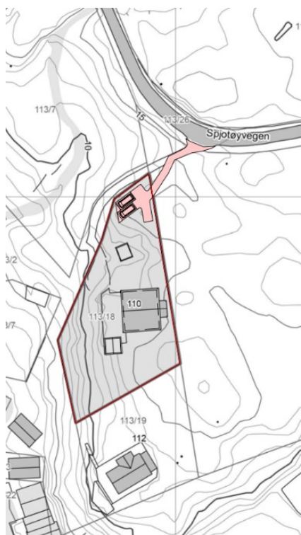
Veg – trasé 1

Alternativ 1 føreset bruk av same avkjørsel frå kommunal veg, men ny vegtrasé og areal for parkering på gbnr 113/18.