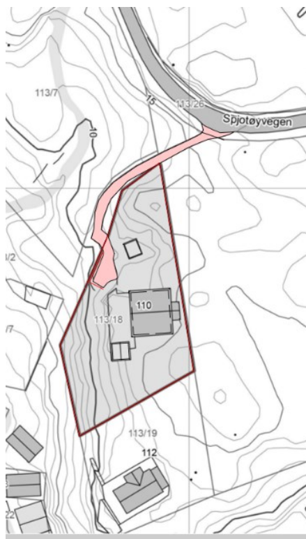
Veg – trasé 2