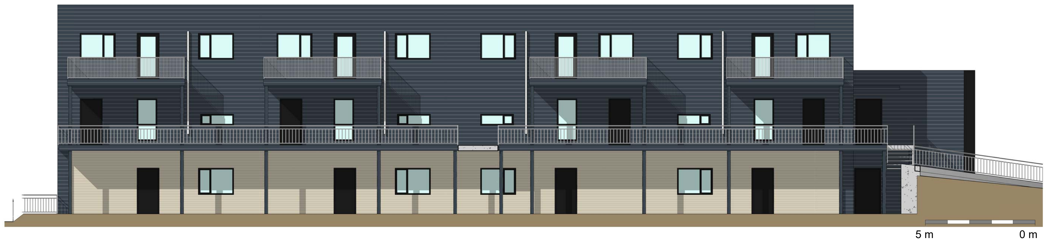
1 Bygg B - NORD 1 : 100