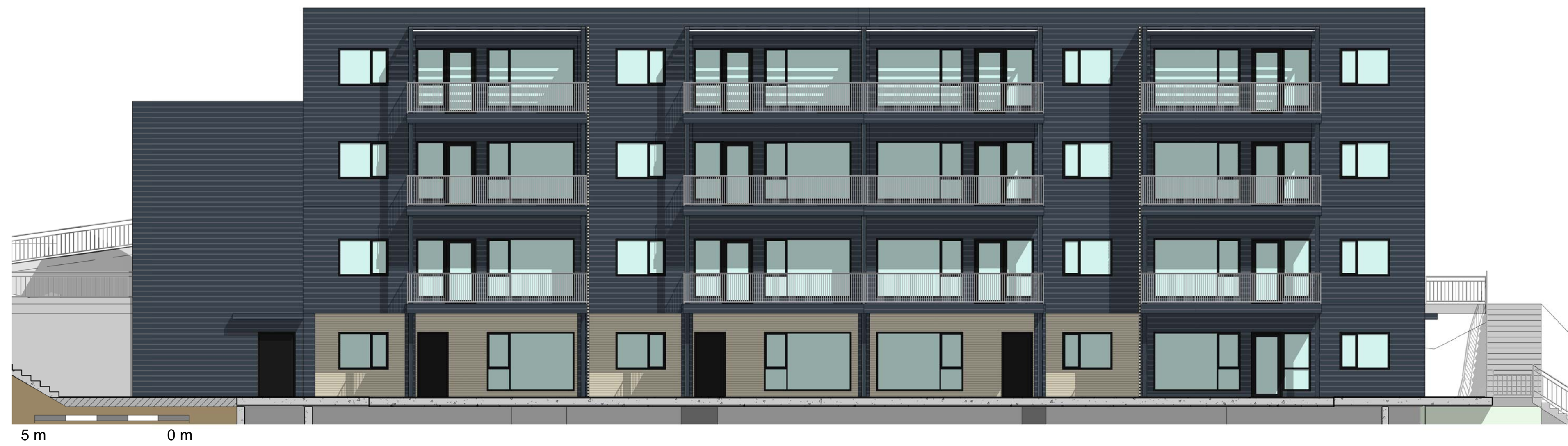
3 Bygg B - SØR 1 : 100