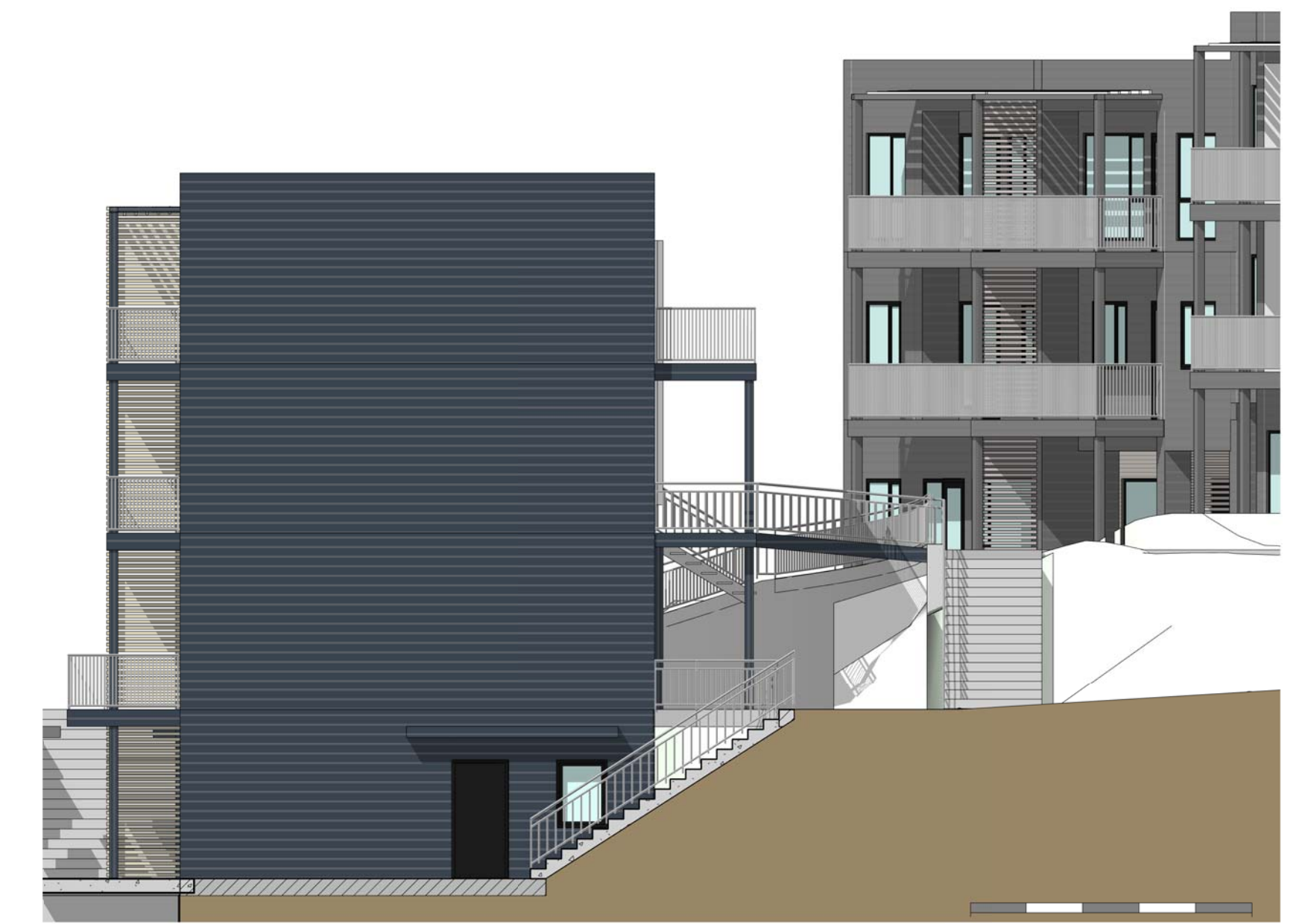
2 Bygg B - ØST 1 : 100