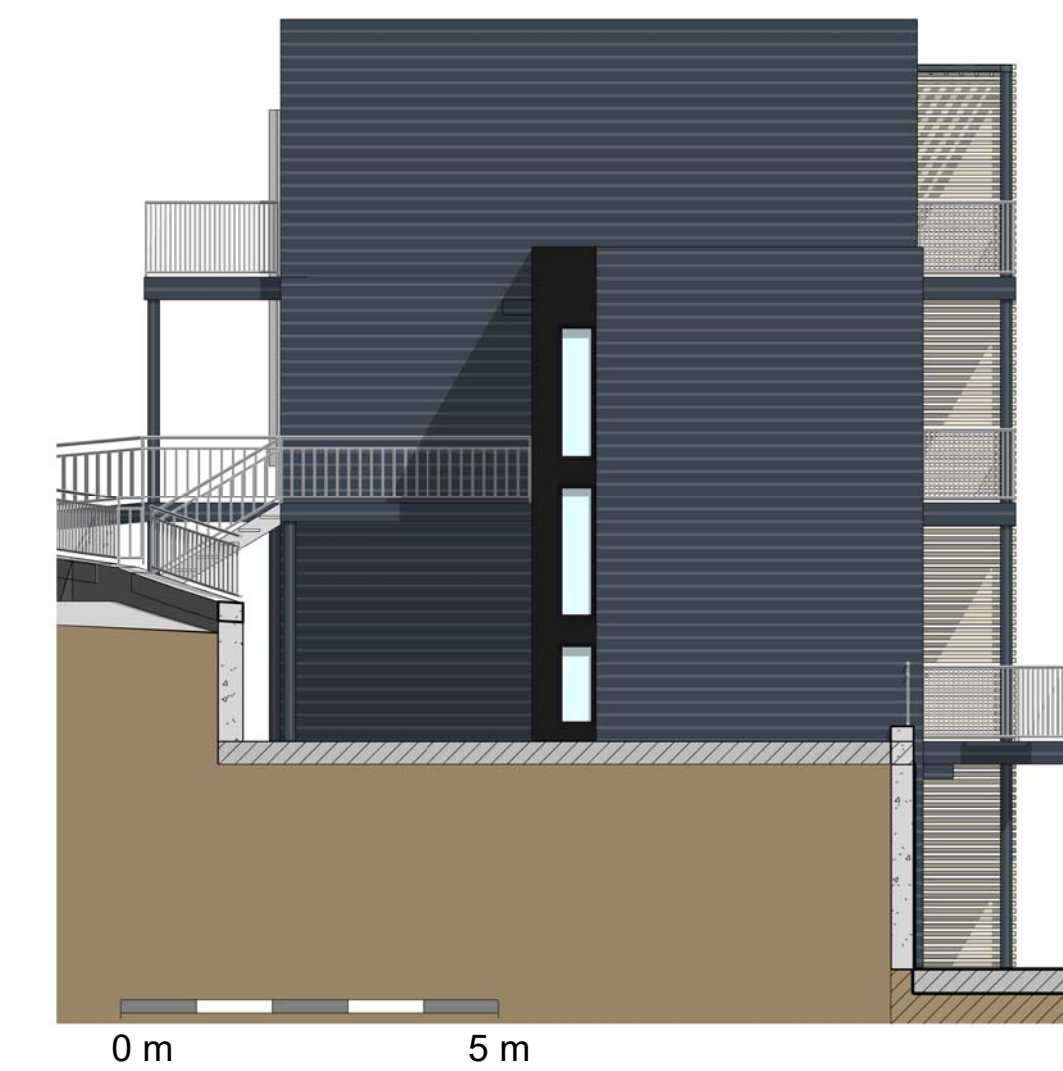
4 Bygg B - VEST 1 : 100