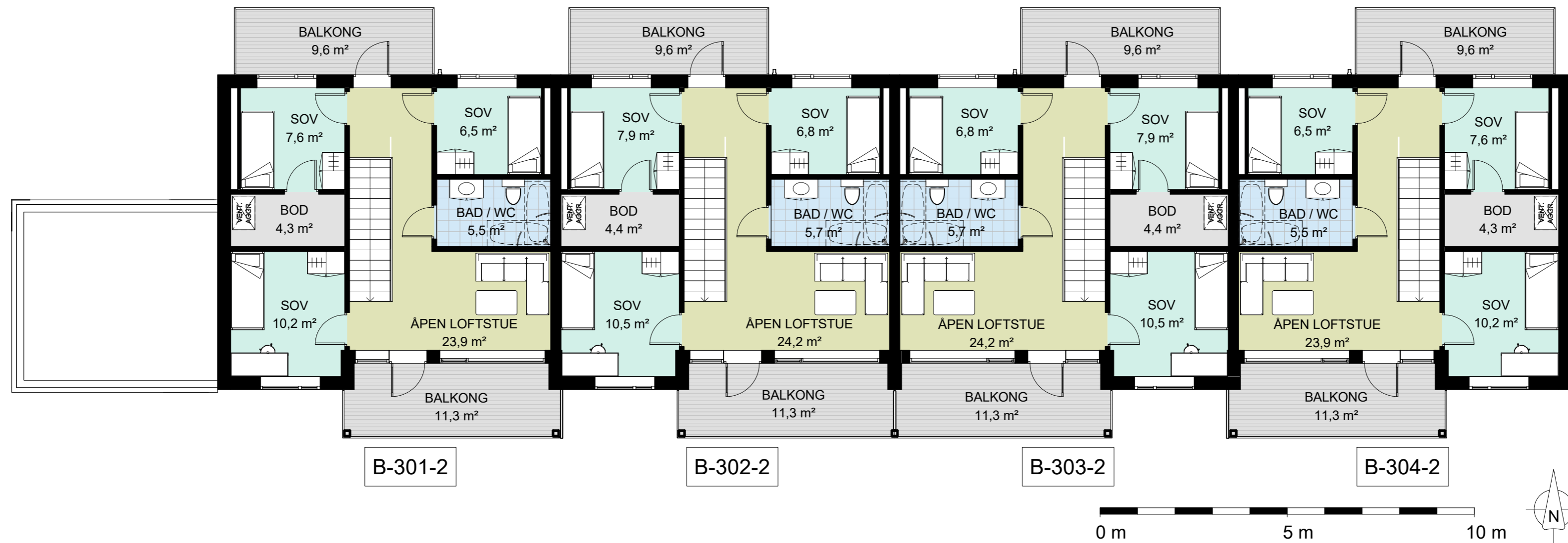
1 Salgstegning - B - 4. etasje 1 : 100