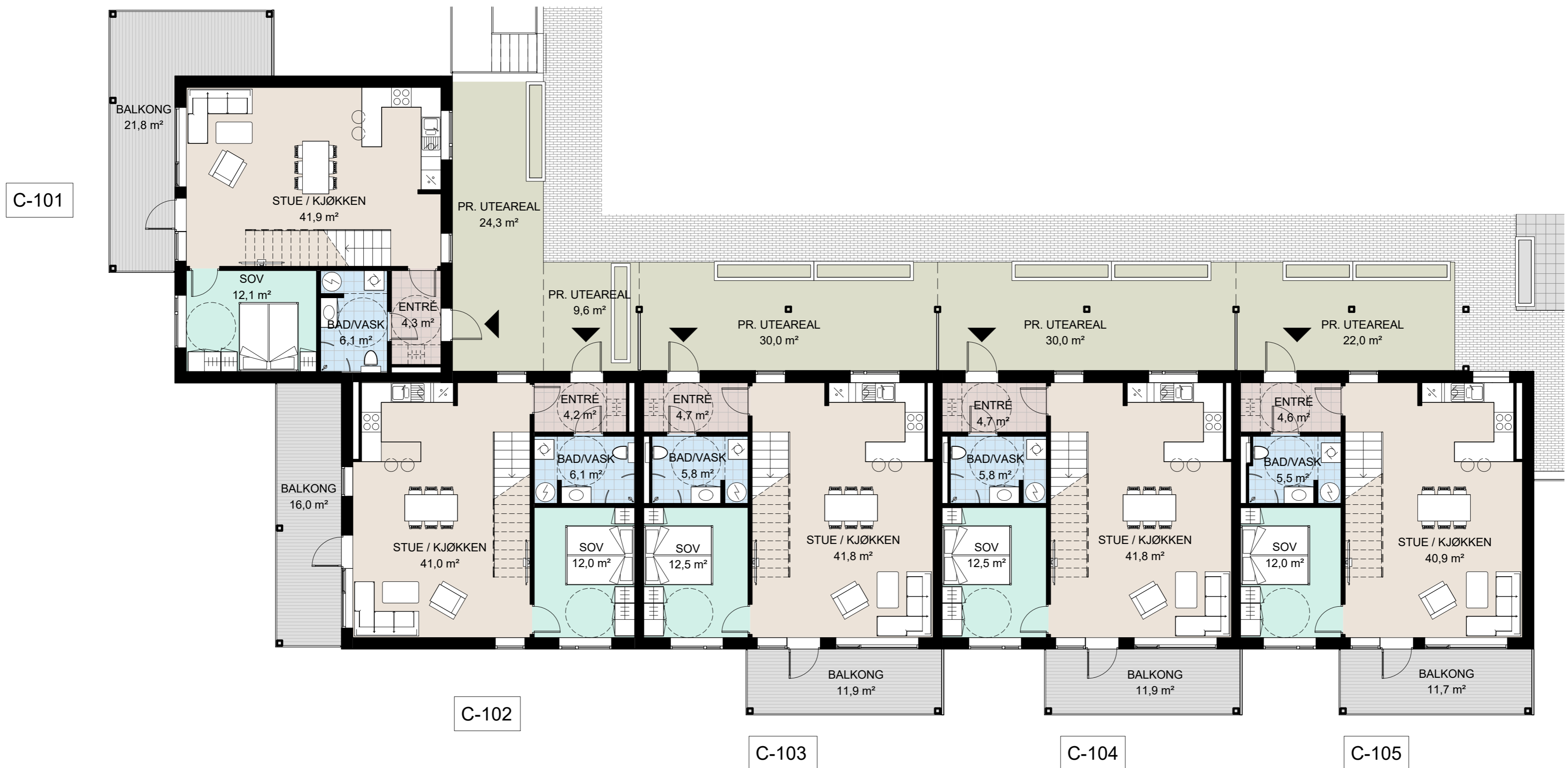
1 Salgstegning - C - 1. etasje 1 : 100