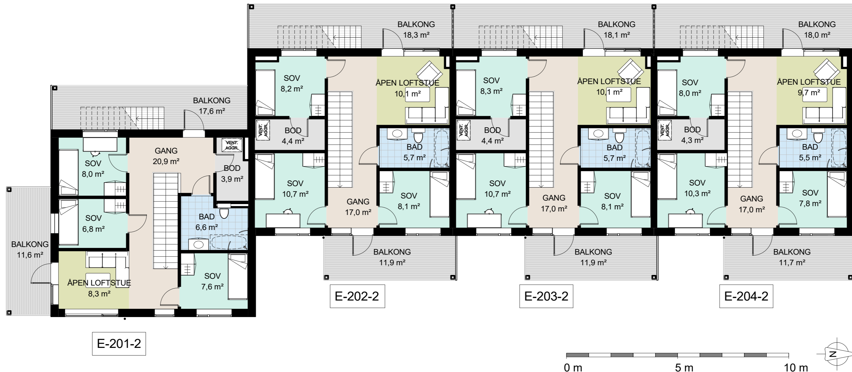
1 Salgstegning - E - 3. etasje 1 : 100