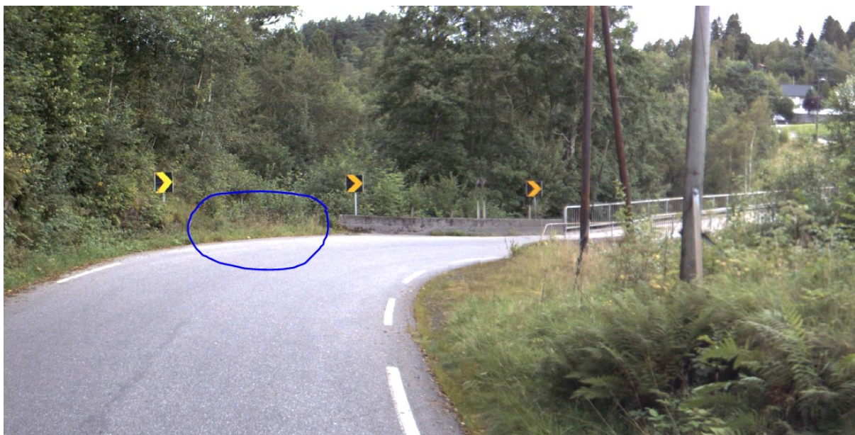
Vegbilette 2017 ved fv. 391 Leknes bru, omsøkt avkøyrslapunkt er markert.

I haldningsklasse 4 legg Rammeplanen til grunn at ein normalt sett kan få godkjenning til avkøyrslar under føresetnad at dei tekniske krava til utforming vert innfridd. Eit absolutt krav vi stiller er at det skal vere tilfredstillande sikt. På synfaring målte vi sikta og vi vurderer at våre krav til sikt kan verte innfridd, dersom avkøyrsla får riktig utforming. Andre krav vi normalt stiller til utforming er at avkøyrsla skal ha svingradius etter dimensjonerande køyretøy og slik at avkøyrsla vert mest mogleg vinkla 90° på fylkesvegen. Vanleg svingradius er 4 meter. Det er også eigne krav til lengdeprofilet, slik at avkøyrsla har fall frå fylkesvegen, og at tilkomstvegen ikkje kjem for bratt på fylkesvegen.