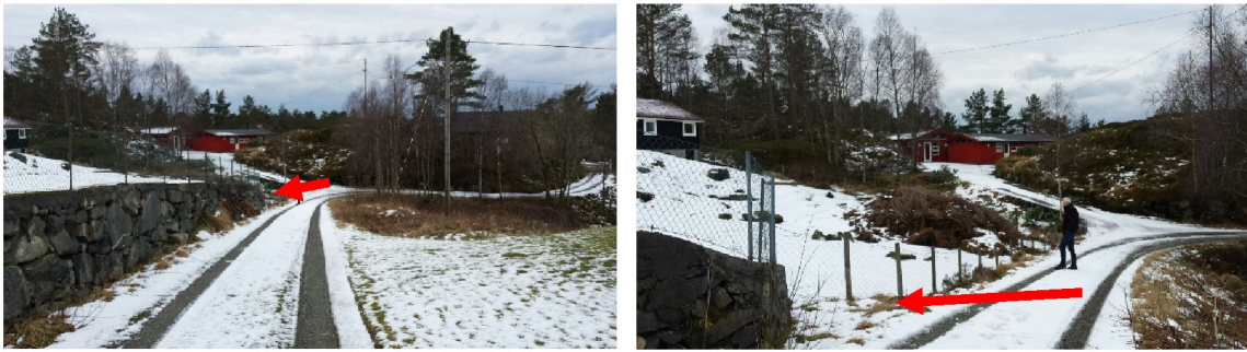
Foto fra øst, ny avkjørsel etableres ved rød pil