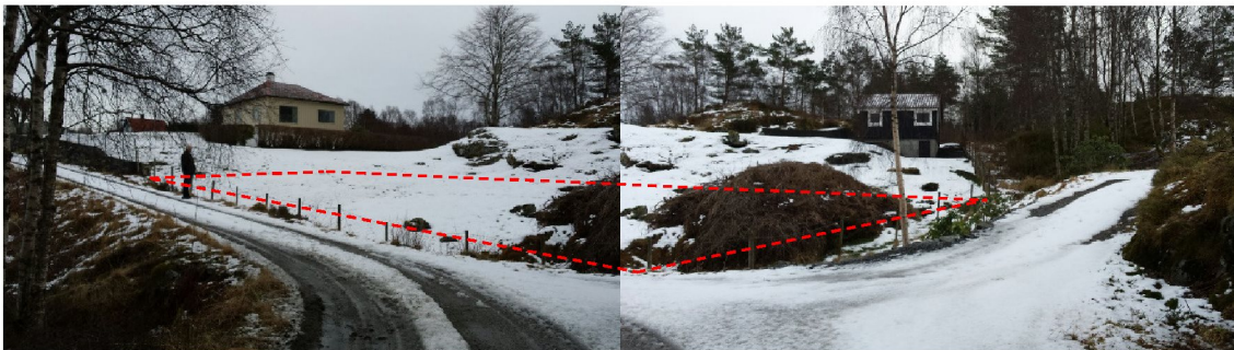
Foto fra vest, ny tomt er vist med rød strek