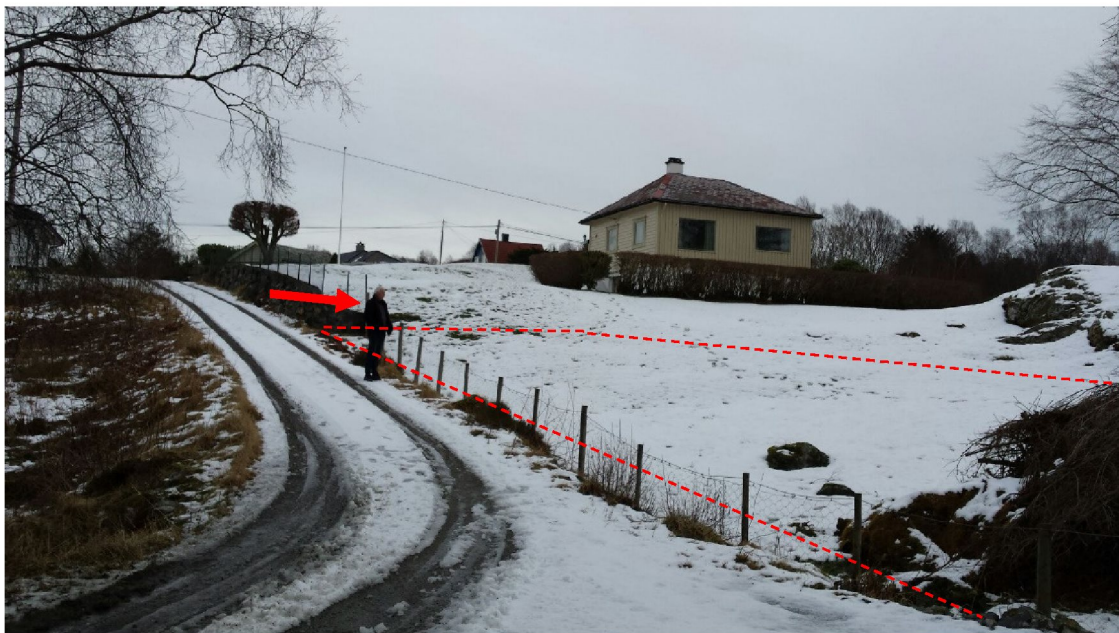
Foto fra vest, ny avkjørsel etableres ved rød pil