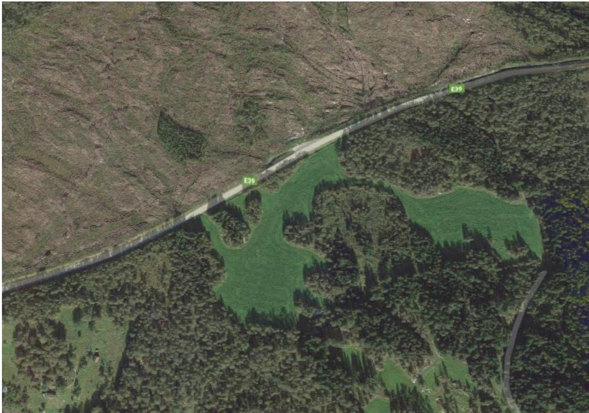
Flyfoto fra området.