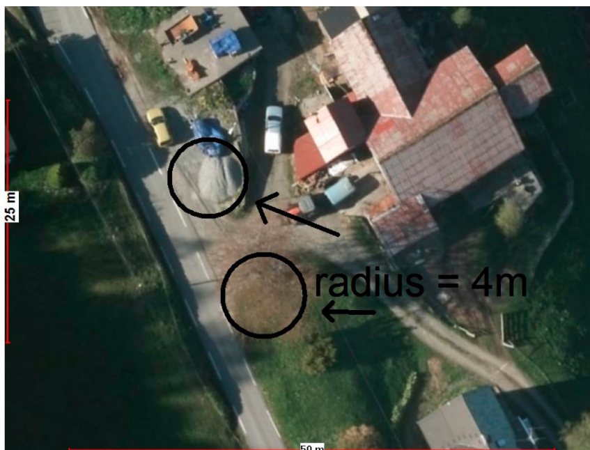
Fig: Svingradius 4m vist på ortofoto.

Til søknaden er det opplyst at eksisterande avkøyrsl skal nyttast. Vi ser at dette neppe lar seg gjere på ein trafiksikker måte. Mellom anna vert svingradiusen langt under det vanlege kravet på 4 meter. Når ein får ei avkøyring i svært spiss vinkel på fylkesvegen vert også siktforholda dålegare. Til vår førre uttale viste vi korleis 4 meter svingradius artar seg terrenget: