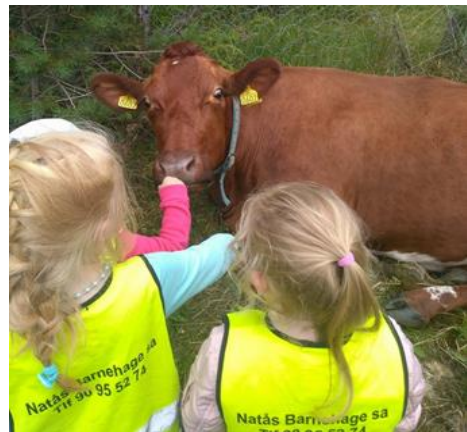
Kyrne ligg rett utanfor barnehagen

Natås Barnehage SA er ein foreldreeigd barnehage, som foreldra driv gjennom eit styre. Styret har ansvar for personale og økonomi. Styrar har ansvaret for den daglege drifta av barnehagen. Barnehagen skal ha eit foreldreråd som består av foreldra/føresette til alle barna i barnehagen, samt eit samarbeidsutval med representantar frå foreldre og tilsette. Su skal vere eit bindeledd mellom foreldregruppa og barnehagen. Sjå elles vedtekter for nærare informasjon.