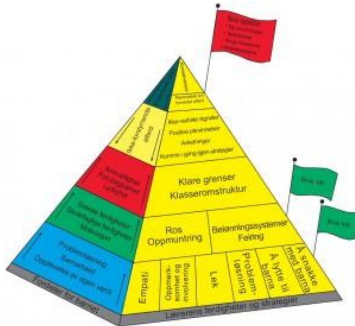
DUÅ sin læringspyramide

Lindås kommune starta i 2011 ei satsing på kompetanseheving hjå personalet i alle barnehagane i kommunen gjennom kursrekkeja «Dei utrulige åra». Natås barnehage er ein av dei siste barnehagane som deltar i opplæringa som går over barnehageåret 2017/2018 med 6 ulike «workshops» med mellomarbeid. Kursrekkeja er i regi av Lindås PPT i samarbeid med Universitetet i Tromsø.