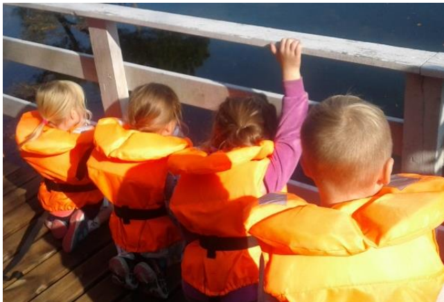
Ved sjøen på Sæverås

Lokala leiges av Natås grendehus. Barnehagen har ein eigen «Camp» ved vegen mot Vabønes, som er base for mange av turane i nærområdet. Der er det satt opp gapahuk og bålpanne. I tillegg er vi så heldig å ha eit skogsområde like bak barnehagen, med tilkomst utan å kryssa trafikkert veg. Vi har mulighet for å gå til sjøen ved Sævråsvåg og andre turområder nært barnehagen.