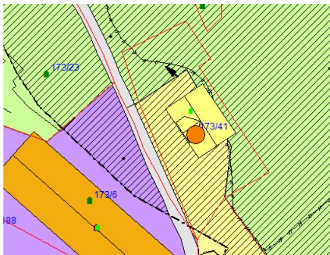
Situasjonsplan, datert 25.01.2018