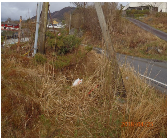
Frisikt retning venstre

Statens vegvesen skal ved si vurdering av saka legge vekt på omsynet til trafikken på og langs vegen. Det må gjerast ei totalvurdering der det utover tilhøva på staden også må takast omsyn til framkomst og trafikktryggleiken på den vegen det er søkt avkøyrslar frå.