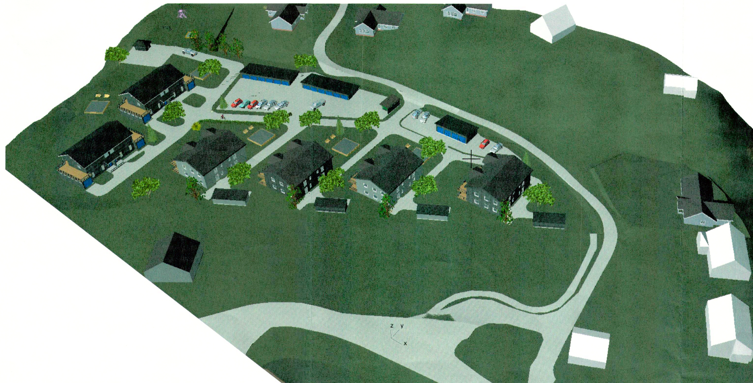
ILLUSTRASJON - SLIK VI SER FOR OSS AT OMRÅDET BK KAN SJÅ UT