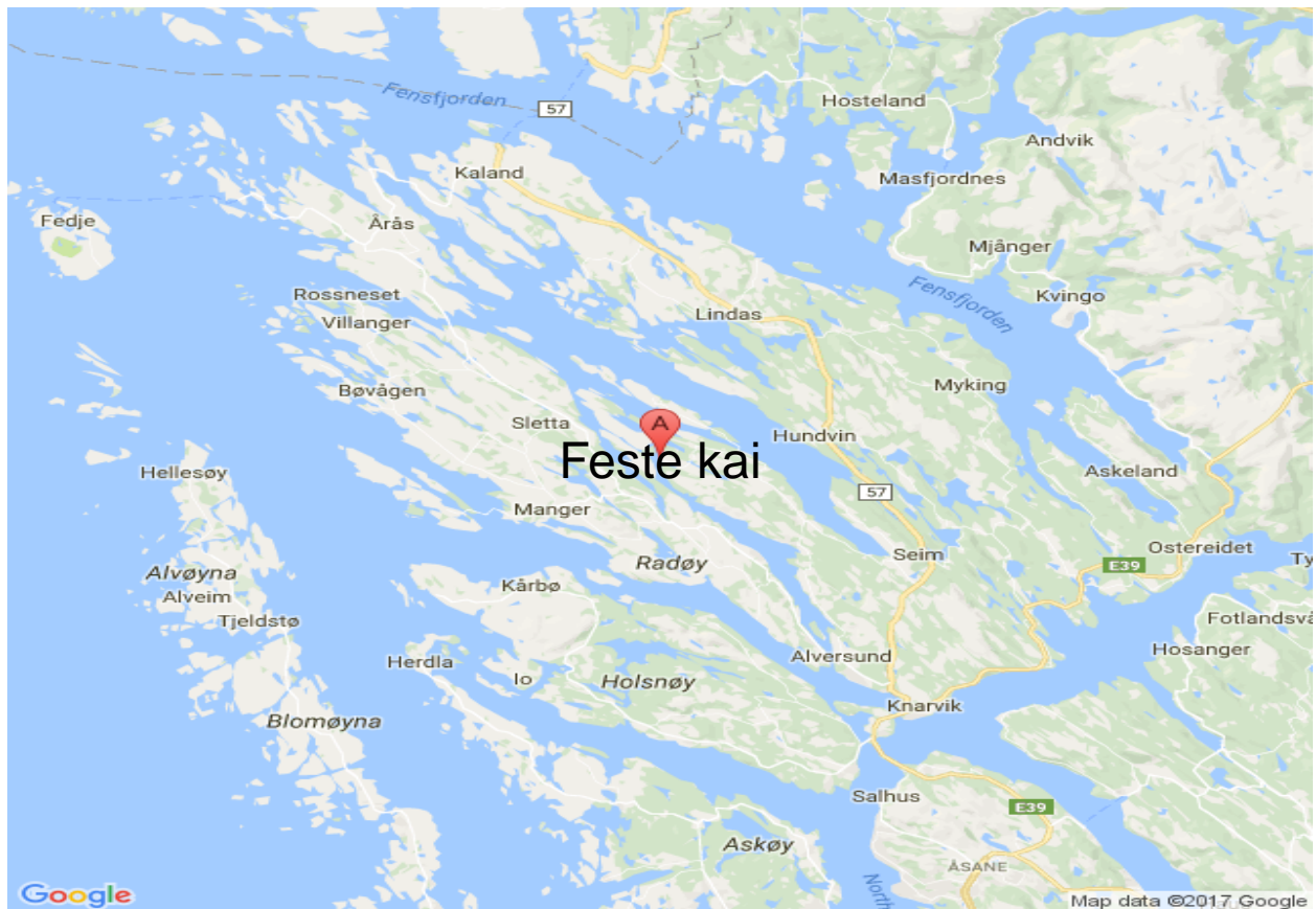
Fig. 2. Kart over Nordhordland.

Topografien i Nordhordland består i hovedsak av fjorder og daler som er orientert i sørøst-nordvestlig retning, se Fig.1. Dette ser vi avspeiler seg tydelig i vindrosen for Feste kai, Fig. 2. I over 45% av tiden blåser vinden mellom 90 og 180 grader (øst til sør) mens i ca. 18% av tiden blåser det fra motsatt retning, dvs mellom 315 og 360 grader (nordvest til nord). Vind mellom 180 og 225 grader (sør til sørvest) har vi i ca. 12% av tiden, mens de resterende vindretningene (225-315, og 0-90 grader) står bare for en liten andel av den totale vindfordelingen.