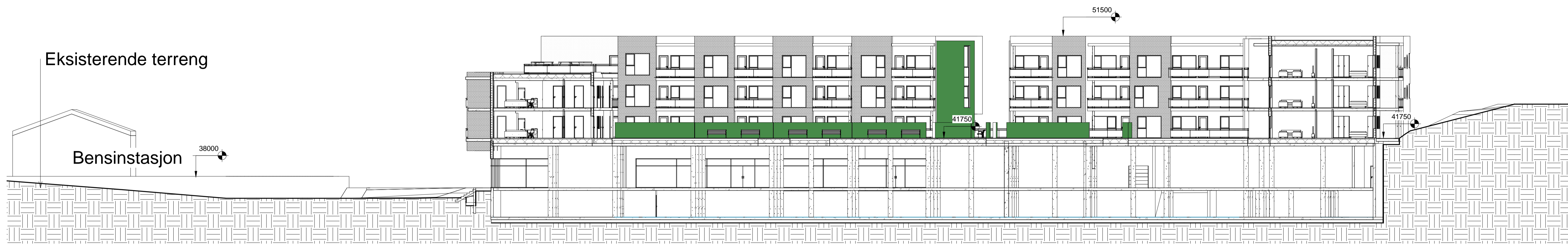
1 Terrengprofil A-A 1 : 200