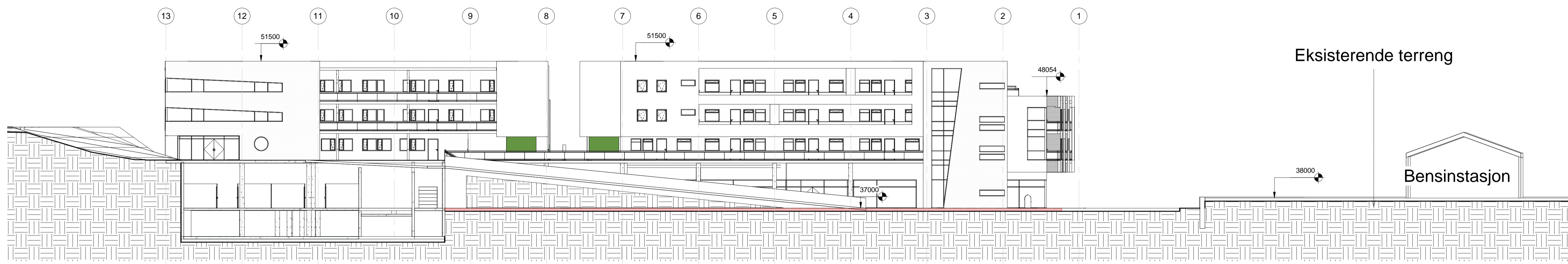
2 Terrengprofil C-C 1 : 200