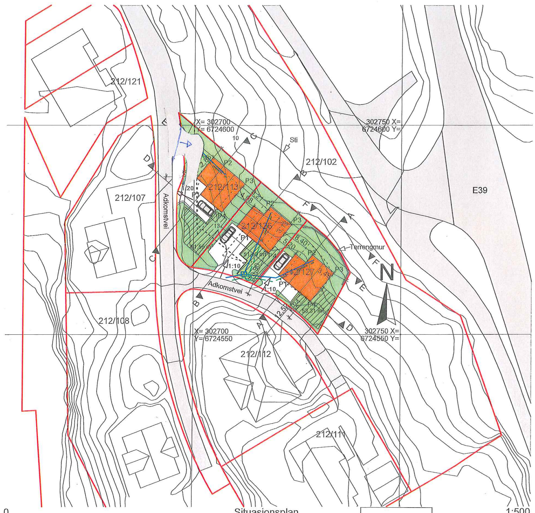
0. Situasjonsplan 1:500