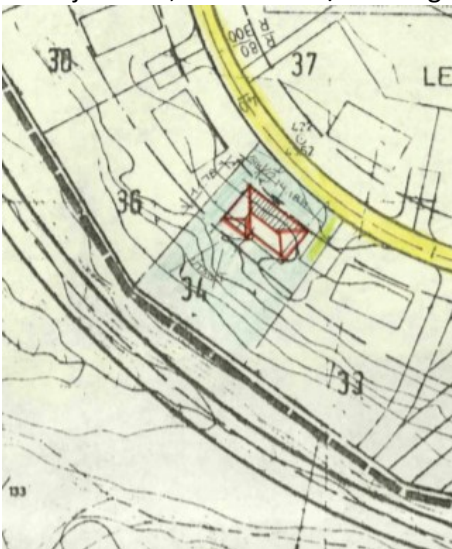
Situasjonskart med byggjegrensa, datert 26.03.2018