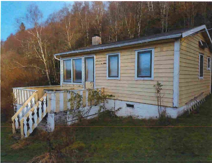
Foto av eksisterende fritidsbustad

Saka gjeld søknad om rehabilitering og påbygg til eksisterande fritidsbustad. Det vert ingen endring i veg, vatn eller avløp for fritidsbustaden som følgje av tiltaket.