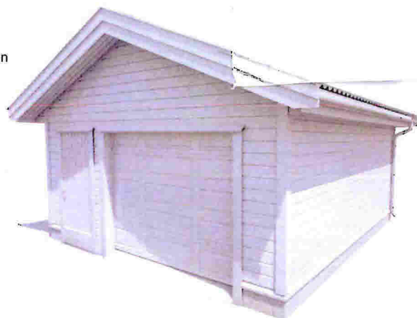
Garasje sett fra forsiden