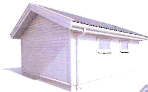
Garasje sett fra baksiden