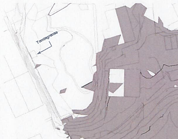
Eks. 21.06 kl. 20:00