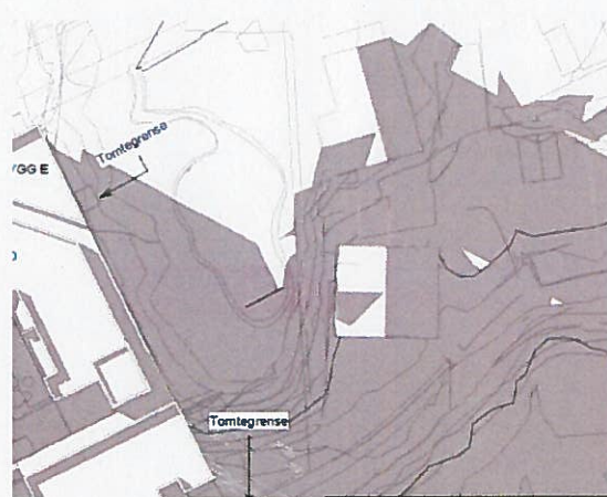
Nytt 21.06 kl. 20:00

Vi kan heller ikke se at dispensasjon fra reguleringsplan for høyde på bygg C vil medføre en forverring av utsikt fra enebolig på gnr. 188 bnr. 501 mot Kvassnesstemma. Eneboligen ligger i dag mye lavere i terreng enn eksisterende bebyggelse på eiendommen.