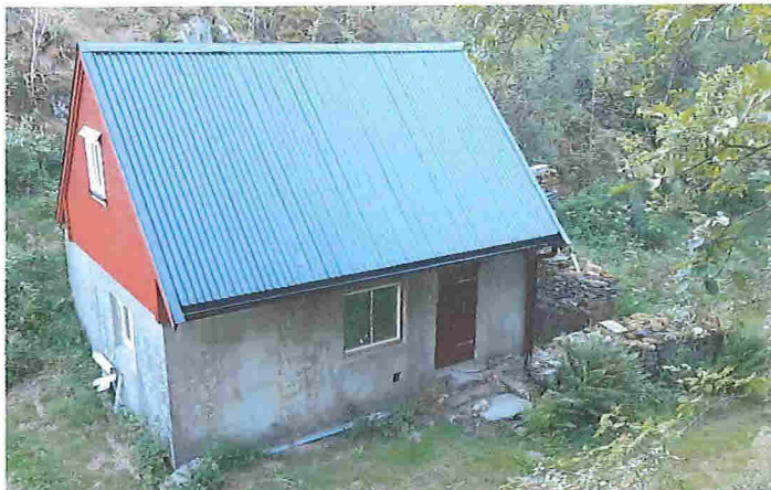
Løa sett fra vest etter at fase 1 er bygd. Grunnmur i stein til høyre skal få tak i omsøkte tiltak, fase 2.