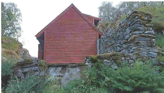
Steinmurene rundt mødding-kjelleren. Lave murer til venstre og i front (1,8-2,0 m. høye med fall innover) forsterkes på topp med betong som underlag for vegg/gulvbjelker. Høy mur til høyre senkes ca. 1,2 m. Ny gavlvegg vil ligge ca. 1,2 m under gavlvegg på den delen som er bygd i fase 1.