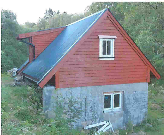
Løa sett fra syd etter at fase 1 er bygd. Dør satt inn ved gamle kjørebro som i den gamle løa. Mangler noe beslag/lasting rundt vinduer. Grunnmur i stein bak til venstre senkes 1,2 m. og får tak i fase 2.