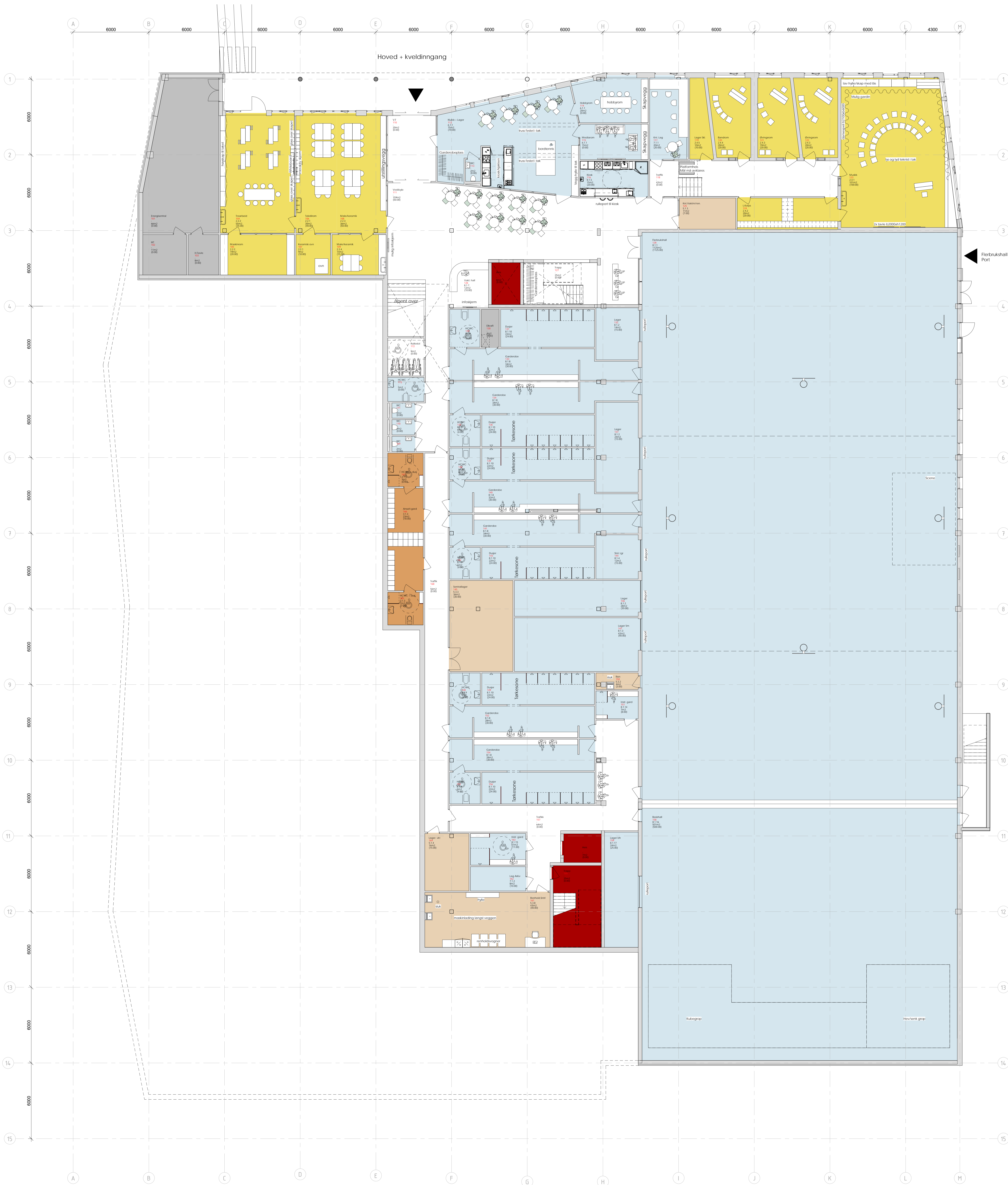
Plan 01 Presentasjon