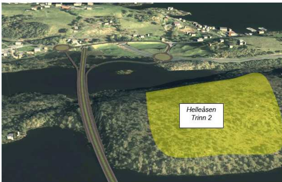
Helleåsen trinn 2, innteikna skissemessig på 3D-teikning frå Statens Vegvesen, Ny E 39 forbi Hjelmås

Dette er eit supplement til innspel som vart levert våren 2018. Dette fordi saka har utvikla seg, og teikningsmaterieil er utarbeidd.