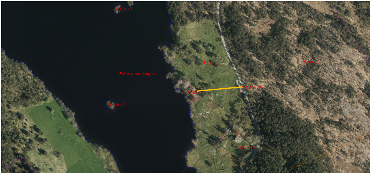
Flyfoto – omsøkt veg vist med oransje strek

Vi er vidare ikkje samd med utvalet i at ein tilkomstveg til fritidsbustaden vil kunne vere eit viktig tiltak for å hindre attgroing av beiteområdet. Tvert om meiner vi at ei oppsplitting av beiteområdet ved framføring av tilkomstvegen, vil svekke samanhengen og kvaliteten til beiteområdet.